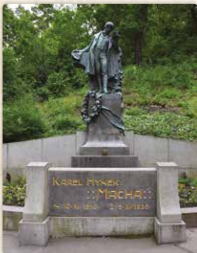
Máchův pomník na Petříně od J. V. Myslbeka