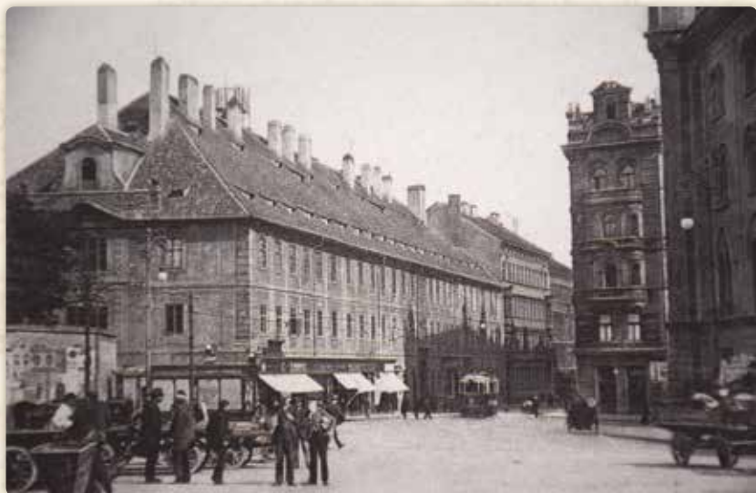
Novoměstský ústav šlechtičen, který vystřídal zrušené Norbertinum (a ocitl se tím pádem na Starém Městě), kolem roku 1900

Miroslav Ivanov se v jinak úžasné knize Důvěrná zpráva o Karlu Hynku Máchovi mylí, když tvrdí, že je to současná Královská. Pravdu má oproti tomu vícekrát zmiňovaný Ruth, který už za svých časů jednoznačně popisuje Benediktskou tak,