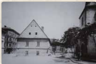
Ještě jeden pohled na Petrskou školu, doslova v předvečer její demolice (1894)