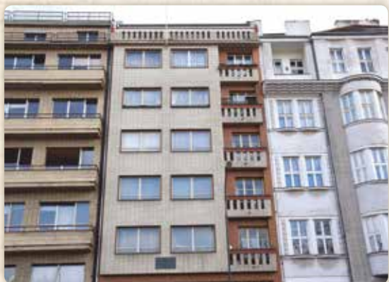
...a její poliklinika dům, kde bydleli Máchovi

a děsivých historek. Třeba o místě před kostelem sv. Ignáce, kde až do roku 1790 stávala zbořenina osmiboké kaple Božího těla, obklopená opuštěným, zarostlým hřbitůvkem. Nakonec magistrát prodal ty trosky jednomu měšťanovi na materiál, a on ji pečlivě rozboural až do základů. A přesto lze prý za větrných nocí na tom místě slyšet tajemné zpěvy dávných chorálů, které jako by zněly z hlubin země. V místech bývalé kaple si chlupci s oblibou prohlíželi černý plochý kámen, na němž byl vyryt kříž, umrlčí lebka s hnáty a letopočet 1627. Prý označoval bývalé popraviště. Zkoumali, jestli by šlo kamenem nějak pohnout, neboť pod ním se podle pověsti nacházel vstup do labyrintu tajných chodeb, táhnoucích se pod celým náměstím až do Faustova domu.