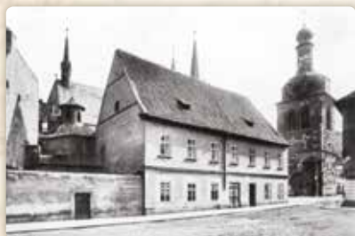
Petrská škola a kostnice v roce 1890, tj. krátce před zbořením – a v podobě, které nabyly až po Máchovi

A kostel svatého Mikuláše s bývalým profesním domem jezuitů, jenž