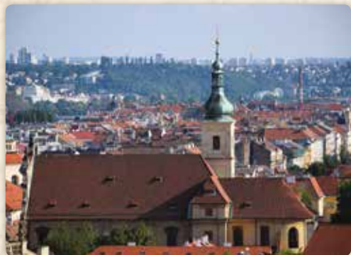
V kostele Panny Marie Vítězné byl pokřtěn...