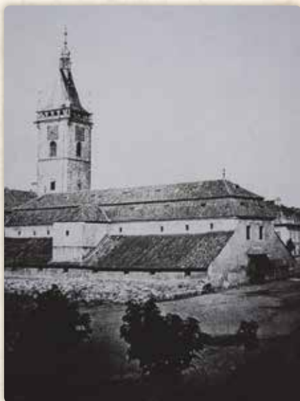
Slanečková bouda na Karlově náměstí krátce před svým zbořením v roce 1863

Jenže by to byl omyl, považovat ho za bohéma; z Máchových zápisků vysvítá, že byl racionální, se smyslem pro pořádek, logiku a matematiku, že si veškeré výpravy pečlivě plánoval, zapisoval výdaje... a neopomněl poznamenat, že aby ušetřil, vlastnoručně si zašil trhliny na starém nátělníku.