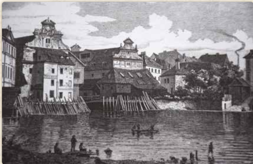
Bedřich Wachsmann: Laguna před Helmovými mlýny od Korunního ostrova (xylografie, 1884)