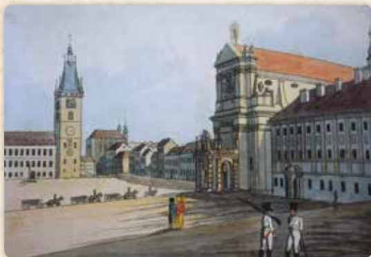
Jsmo v době Máchova narození – kolorovaný lept A. Gustava byl pořízen kolem roku 1810. Jeho středobodem je kostel sv. Ignáce na Dobyčtím trhu

Například hned v sousedství se nacházel nárožní dům U Kamenného stolu, tehdy už hodně zchátralý. Co vedlo k jeho názvu? Zřejmě tady skutečně stával kamenný stůl, u něž městský zřízenec vybíral poplatek z dobytka, hnaného na Dobyčtí trh. Také se říkalo, že ten stůl sloužil řezníkům k pouličnímu prode-