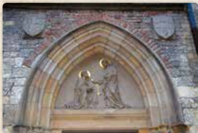
Tympanon nad vchodem do svatyně