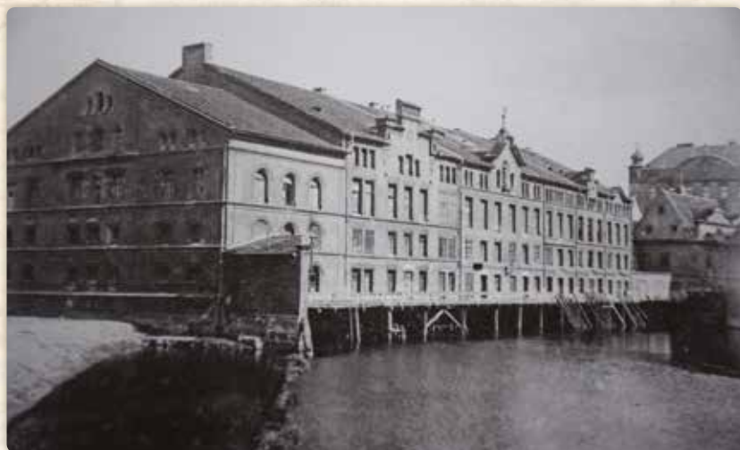
Dolní Lodecké mlýny od severovýchodu. Po požáru starých, dřevěných, dostaly jednotnou romantickou fasádu, pod níž se skrývalo sedm samostatných, majetkově oddělených provozů. Násyp vlevo je spojoval s Korunním ostrovem. Vpravo v pozadí Freundův mlýn a Špačkův dům (s nárožními věžičkami – viz pátá kapitola)