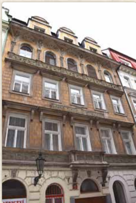
Jeden z hezcích domů v sousedství Máchových bydlíšť: Benediktská 691/5

Tehdy čekalo jeho rodinu poslední stěhování: na proslulý Dobytčí trh.