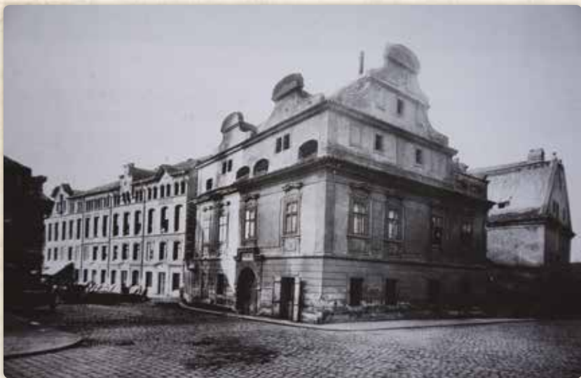
Další pohled z Klimentenské ulice na Freundův mlýn a řadu Dolních Lodeckých mlýnů