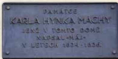
Pamětní deska, která upomíná na Máchův pobyt na Dobyčtím trhu

Faustův dům byl dalším místem podněcujícím fantazii; Hynek se přímo vžíval do pocitů učence vyzývajícího pekelné síly.