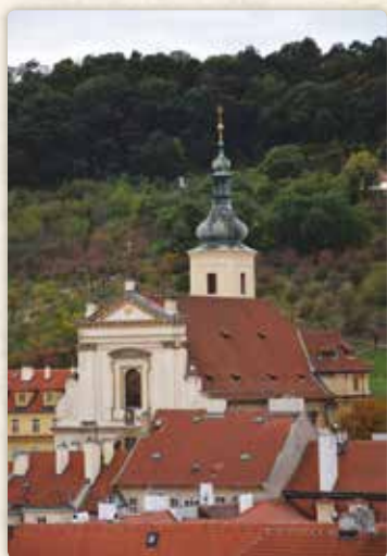
Kostel Panny Marie Vítězné, viděný z Malostranské mostecké věže