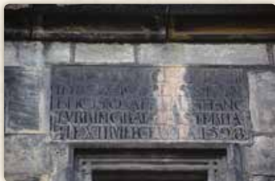
Pamětní deska na zvonici dosvědčuje její vysvěcení v roce 1598

Ke klášteru bosých karmelitánů kdysi patřila dodnes existující Seminářská zahrada. V jinošském věku do ní chodíval i Karel Hynek. Ovšem nevedla ho k tomu nostalgie po ztraceném dětství, jak by Vás možná napadlo. V dobách, kdy veřejně zpívat české písně nebylo bez rizika a ti, kteří tak činili, se vystavovali možnému postihu, si sem on a jeho spolustudenti chodili zapět v rodném jazyce.