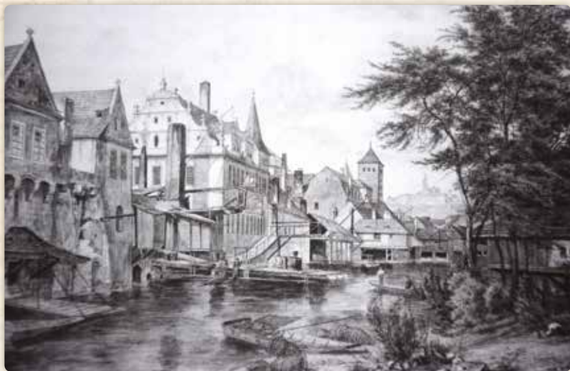
Bedřich Havránek: Laguna mezi Novými a Dolními Lodeckými mlýny (akvarel, 1853)