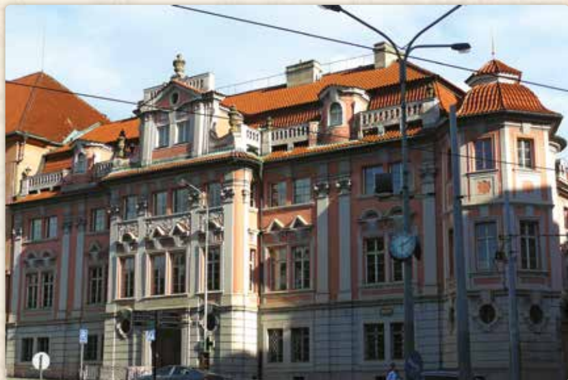
Dvě legendární stavby Karlova náměstí: dochovaný Faustův dům...