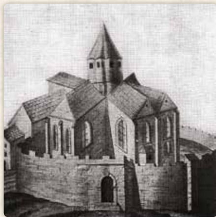
...a zaniklá kaple Božího Těla

a temnou komoru (snad původně nějaké skladiště), která měla jediné okénko do špinavého dvora. Michal se v ní příliš nezdržoval; pobýval ve mlýnské šalandě a doma se stavoval jen k nedělním obědům. Tím pádem tam býval