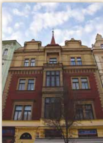
Dům U Černého orla (Újezd 402/33)

K básníkově skonu se dostaneme později. Nyní vstupme