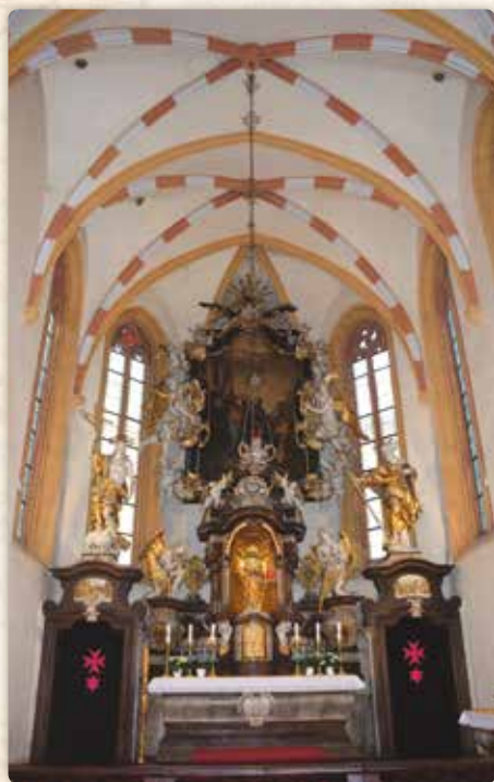
Ještě jednou navštívíme kostel svatého Petra

v nich, že se tu ...zpívalo pod záštitou kleriky bez obavy, když tam byli někteří alumnové s námi smýšlející procházkou... K tomu je třeba vysvětlit – název to napovídá –, že zahradu po zrušení kláštera vlastnil Arcibiskupský seminář. Alumnové jsou pak seminaristé, kteří v duchu Machových slov „krylí“ něco tak „protistátního“, jako byl sborový zpěv národních písní.