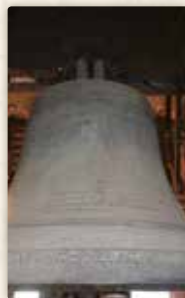
...a těšil se na vzrušující zážitek při vyzvánění!