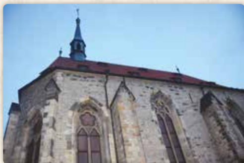
Kostel svatého Salvátora v areálu Anežského kláštera

a jako by jejich zvuk rozkmital paprsky světla, padající dovnitř okny v kopuli. Pohyb stínů dodával zdání živosti přísným bělostným sochám světců. Ve vnímavé chlapecké duši zanechaly tyto zážitky hluboký dojem. Zdálo se,