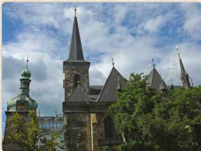
Kostel svatého Petra na Novém Městě se zvonící alias Petrskou věží

ho Pražského Jezulátka, za kterým dodnes míří poutníci z celého světa. O Máchovi jim není nic známo – a možná jste si našeho hrdinu s tímto kostelem dosud nespojovali ani Vy. Určitě se sem vypravte nejen kvůli Jezulátku; uchvátí Vás třeba „mědí zclacené“ sochy. Těžko popsat tu nádheru, tohle musíte vidět!