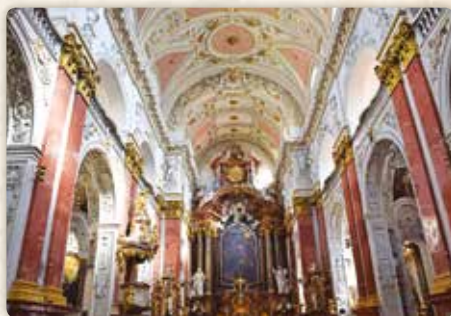
Kostel sv. Ignáce na Karlově náměstí a jeho interiér