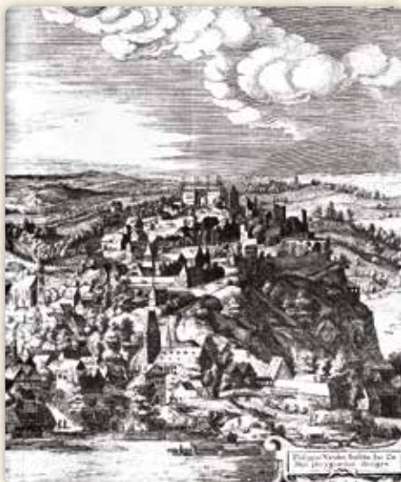
Dobové pohledy na Vyšehrad, jehož proslou slávu Hynek tolik obdivoval