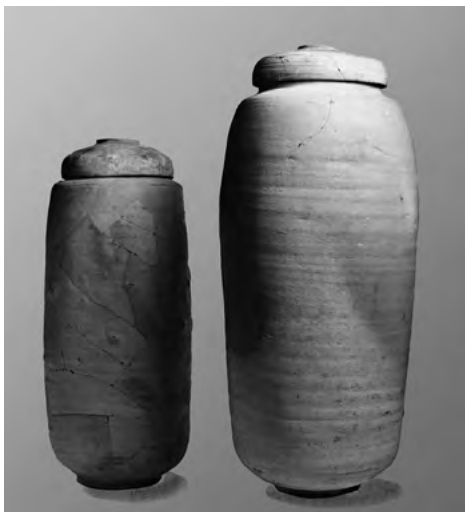
Hliněné džbány, v nichž byly uloženy svitky.