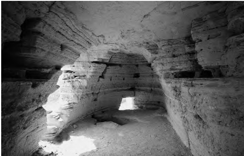
Pohled do nitra jeskyně 4 pod slánovou terasou.