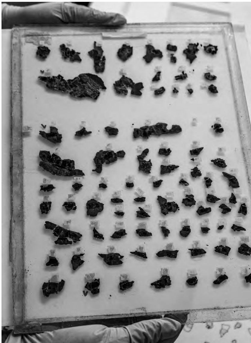
Moderní způsob uchovávání zlomků v laboratoři kumránské sekce Izraelského památkového úřadu (Israel Antiquities Authority, IAA).