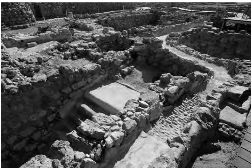
Vodní systém v Kumránu. Kanál a mikve se schody.