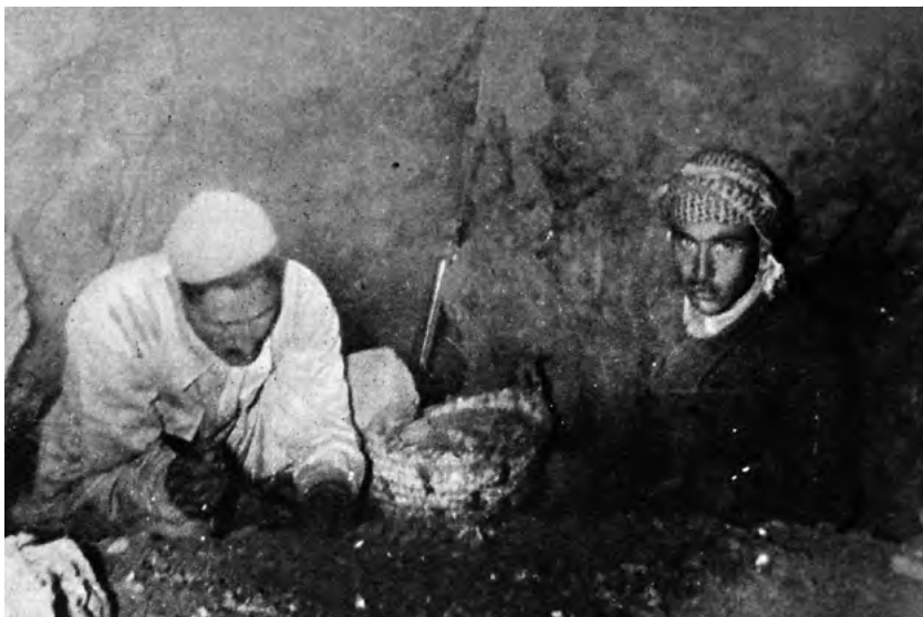
Beduíni pátrající v jeskyni po fragmentech svitků (1949, rekonstrukce).

rovněž nedaleko Jericha a v hliněných džbánech. Od Eusebia se dovídáme, že se jimi zabýval už Órigenés (185–254). Tento velký křesťanský učenec napsal monumentální textověkritické dílo zvané Hexapla („šestero“), v němž v šesti sloupcích uvádí a vzájemně srovnává různé hebrejské a řecké verze Starého zákona. Jedna z řeckých verzí žaltáře pochází z nálezů u Jericha.