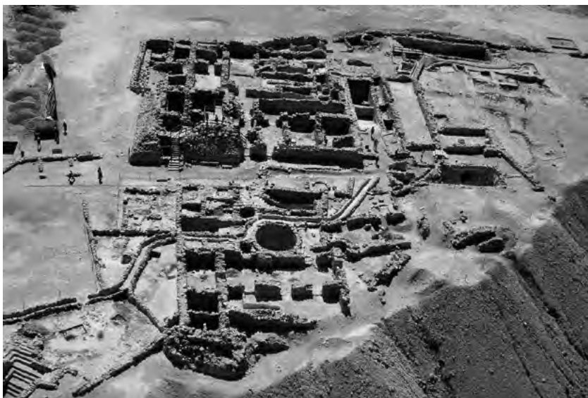
Pohled shora na vykopávky sídliště Chirbet Kumrán.