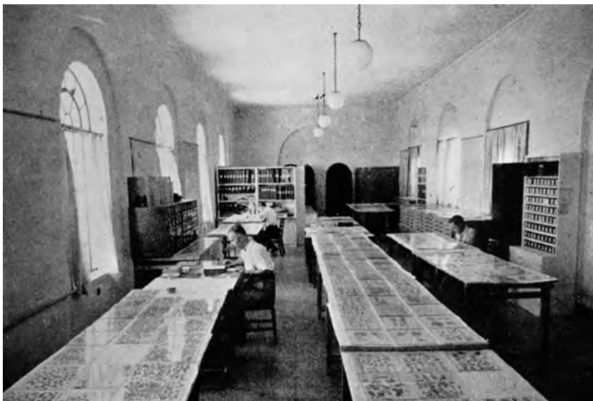
Sál svitků v Rockefellerově muzeu v Jeruzalémě, pracoviště mezinárodního týmu badatelů.

vyvolávalo otázky, ale mělo jiné důvody. Jedním z nich byla blížící se generační výměna v odborných kruzích, dalším změněná politická situace po šestidenní válce v r. 1967. Navíc se vyskytly interní a osobní problémy mezi vydavateli.