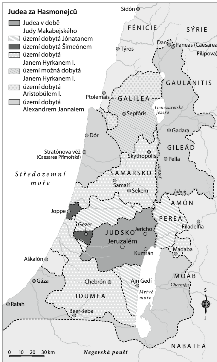
Judea za Hasmonejců.