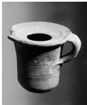
Kalamář nalezený v Kumránu.