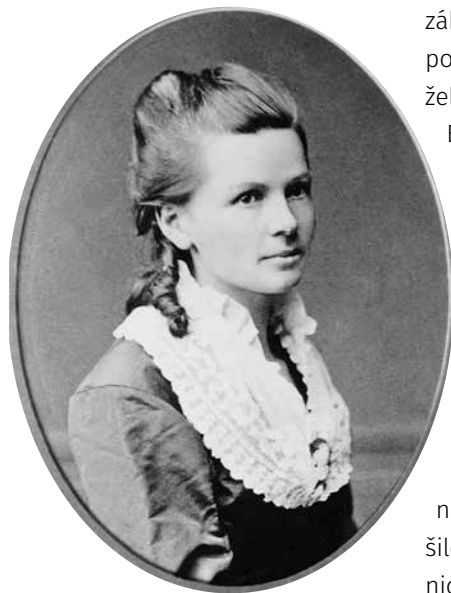
Bertha Benz, 1870

základ budoucímu úspěchu firmy. Dva roky po své památné jízdě navíc porodila manželovi ještě páté dítě.