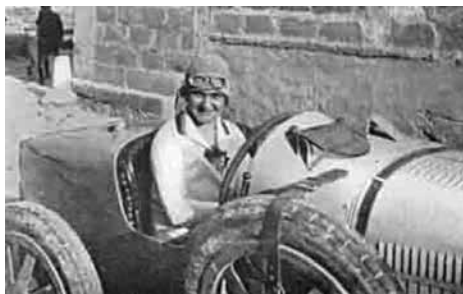
Eliška Junková na voze Bugatti, Targa Florio 1927