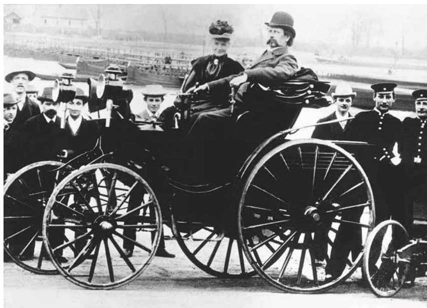
Bertha Benz s manželem, 1894