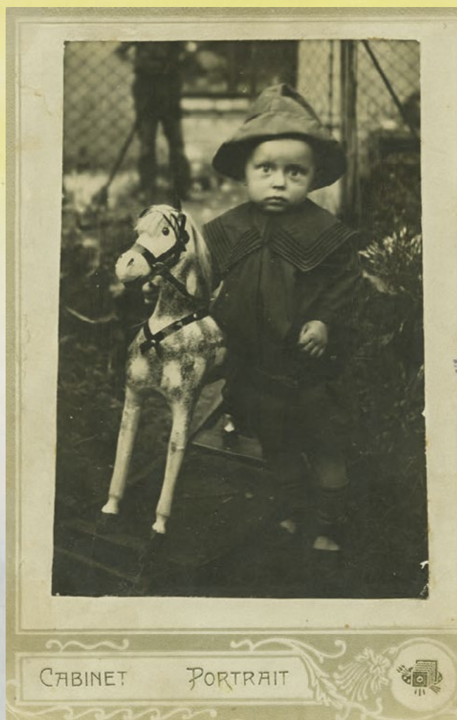
Malý Karlík, již tehdy milovník koní.