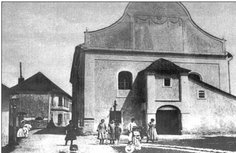
První synagoga v Humenném z roku 1787, v pozadí ješiva (židovská škola).

Vrací se do dávné minulosti. Všech pět dívek pozorně naslouchá.