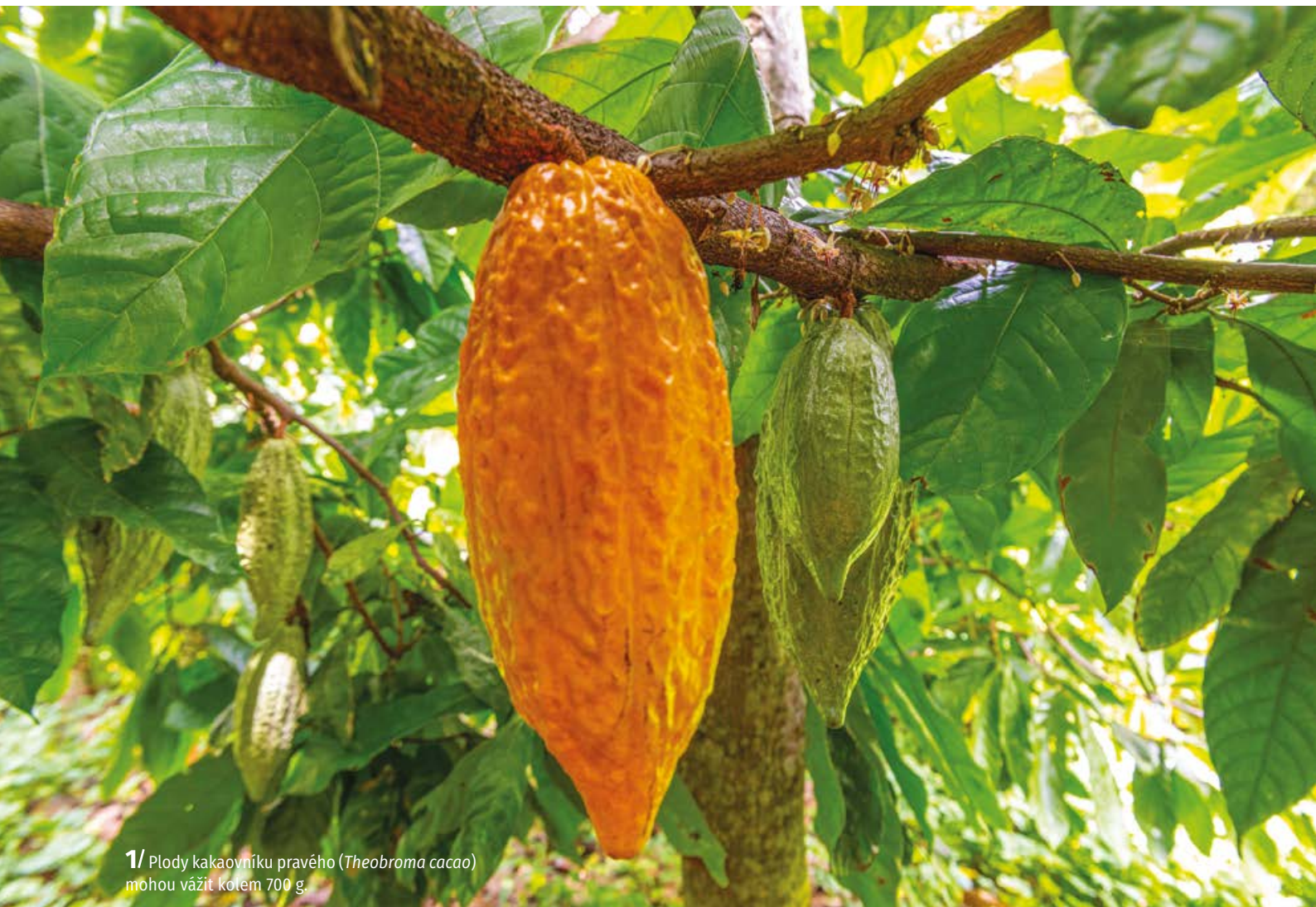
1/ Plody kakaovníku pravého ( Theobroma cacao ) mohou vážit kolem 700 g.