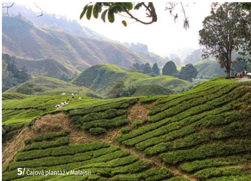
5/ Čajová plantáž v Malajsi

Mezi další typy čaje patří kromě již zmíněného černého a zeleného čaje i čaj bílý , který je jen lehce fermentován, čaj žlutý , který je fermentován dodatečně. Také se setkáme s čajem polozeleným (oolong) , kde proces fermentace proběhl jen částečně, či čaj puerh (červený čaj) , který je fermentován dokonce dvakrát, a při jedné z fermentací se do procesu přidávají mikroorganismy (houby rodu Aspergillus , Rhizopus , Penicillium a další), jejichž výběr má vliv na proces fermentace a výsledné složení obsahových látek. 🌱