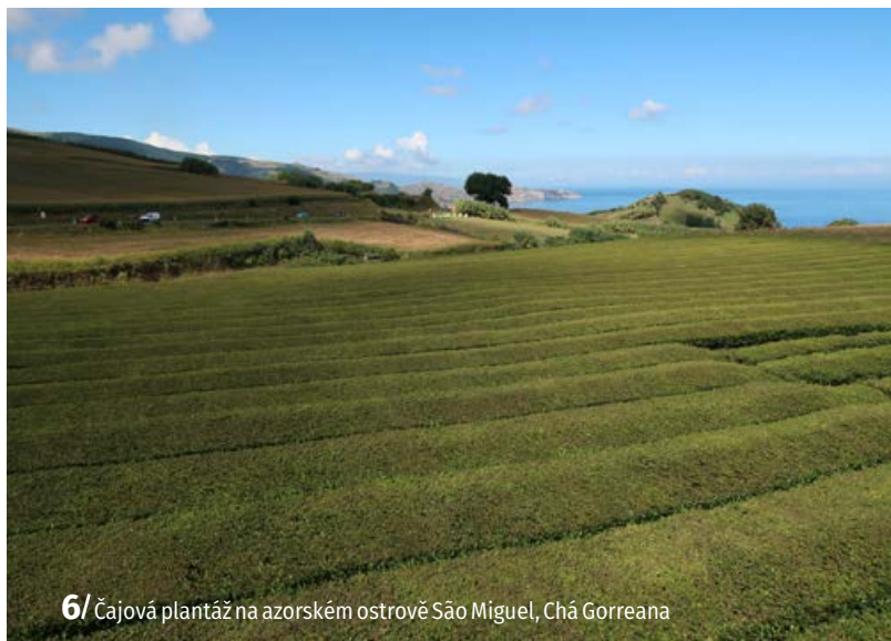
6/ Čajová plantáž na azorském ostrově São Miguel, Chã Gorreana