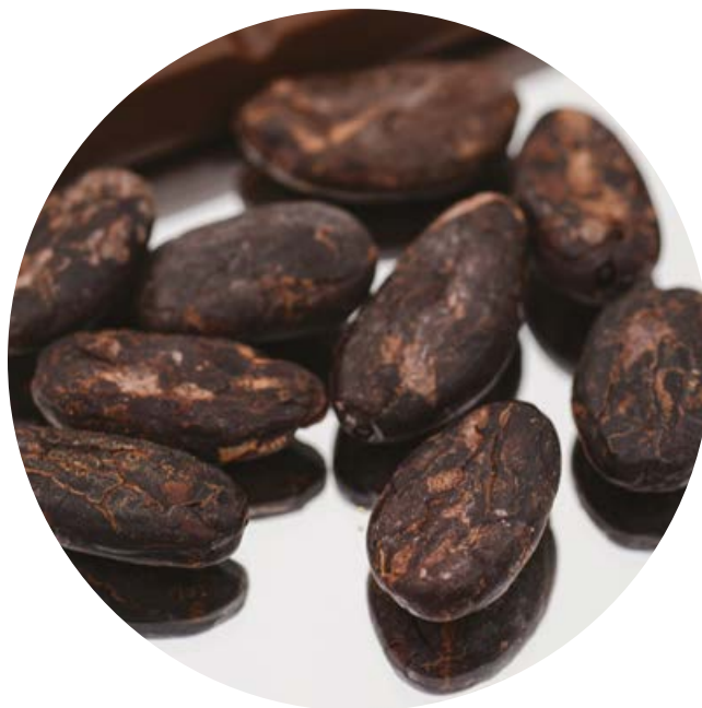
6/ Pražené kakaové bobí

Celkem rozeznáváme 22 botanických druhů kakaovníku s několika poddruhy . Jmenujme alespoň kakaovník peruánský ( Theobroma bicolor ), rozšířený v oblasti severní části Jižní Ameriky až na jih Mexika. Jeho semena mají vyšší obsah tuků a méně theobrominu. Kakaovník velkokvětý ( T. grandiflora ) s až kilogramovými plody roste zejména v Brazílii, zasahuje však i do Kolumbie a Ekvádoru.