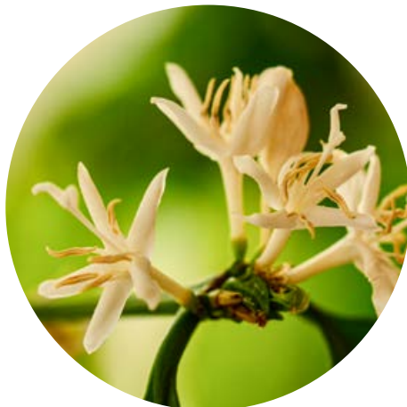
2/ Květy kávovníku vydávají silnou omamnou vůni.

Podle nejnovější molekulární studie vznikl kávovník arabský křížením již zmíněné robusty, tj. k. statného, a druhu C. eugenioides někdy v období mezi 1,08 milionu let a 543 000 let. Jediné samosprašné druhy jsou kromě kávovníku arabského C. heterocalyx a C. anthonyi .