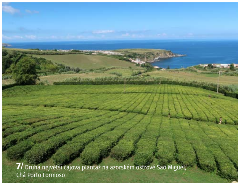
7/ Druhá největší čajová plantáž na azorském ostrově São Miguel, Chã Porto Formoso