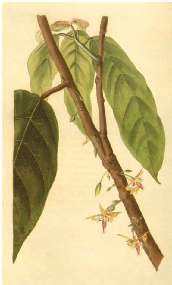
3/ Květy kakaovníku pravého vyrůstají přímo na větvích či kmeni stromu, jsou kauliflorní.