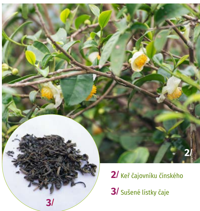
2/ Keř čajovníku čínského

je dlouhodobější. Bioaktivní látky (detailněji viz rámeček) obsažené v čajovníku mají kromě chuti a vůně čaje i celou řadu léčivých účinků pro prevenci a léčbu kardiovaskulárních nemocí, rakoviny, zažívacích potíží a metabolických dysfunkcí, jako je obezita či diabetes. Flavonoidy v čaji obsažené jsou také silné antioxidanty. Kofein a polyfenoly mají neuroprotektivní účinek u Alzheimerovy a Parkinsonovy nemoci (působí na GABAergních, dopaminergních a glutamatergních receptorech). Účinky na nervový systém a jejich možné využití k léčbě neurologických a psychických onemocnění jsou v současné době předmětem řady studií. Katechiny působí protizánětlivě. Theofylin má bronchodilatační účinek a používá se k léčbě astmatu a chronické obstrukční plicní nemoci.