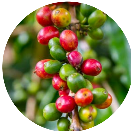
3/ Plodem kávovníku je peckovice obvykle se 2 semeny chráněnými pevným osemením.