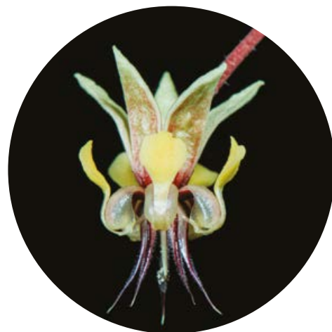
2/ Květ kakaovníku pravého je oboupohlavný s růžovým kalichem a bělavou korunou.

Chceme-li jít po stopách původu čokolády, která je jednou z neodmyslitelných součástí našeho jídelníčku, musíme se, alespoň teoreticky, vydat do oblastí tropické Střední a Jižní Ameriky. Zde je místo původu stromu, který nese latinské jméno Theobroma cacao (kakaovník pravý), za které vděčí zakladateli binomické nomenklatury C. Linnému a které v překladu neznačí nic menšího než pokrm bohů. Již staří Olmékové, Mayové i Aztékové kakaovník dobře znali a velmi si jej cenili. Kakao však již dávno není jen výsadou vládců před věky padlých říší, ale rozsáhlé pěstování kakaovníku se rozšířilo do tropů celého světa a najdeme je tak v nepřeberném množství potravin. Čím si kakaovník zasloužil již pradávno takové výsostné postavení a co na to říkají nejnovější výzkumy?