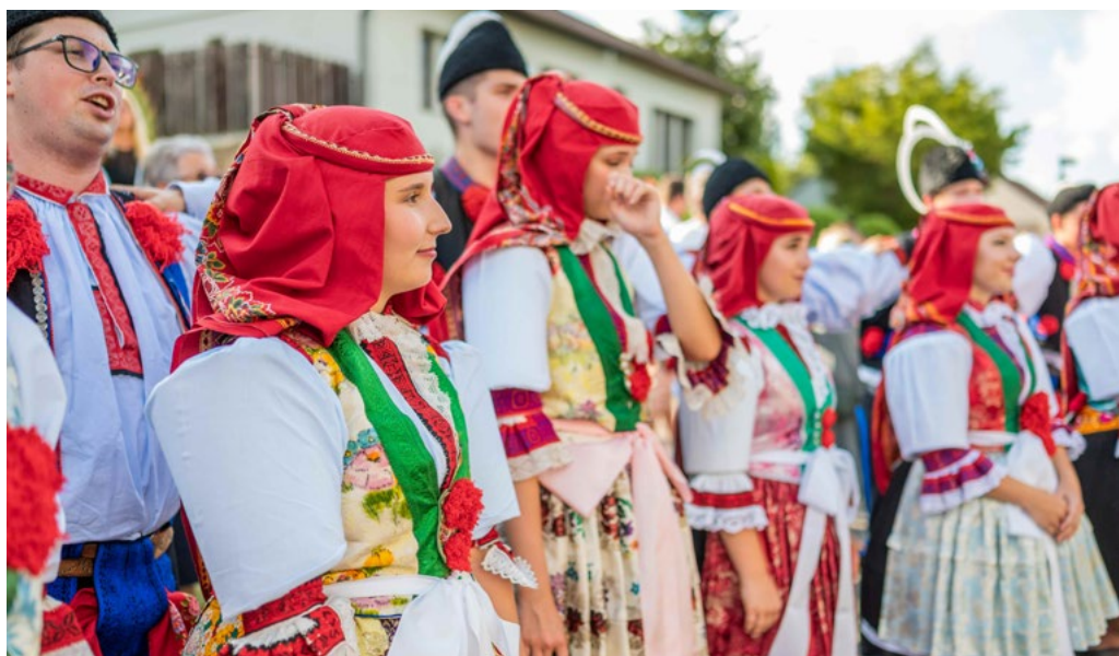
↑ Ženský kroj z Míkovic jako ukázka jednoho ze specifických způsobů vázání šátku.