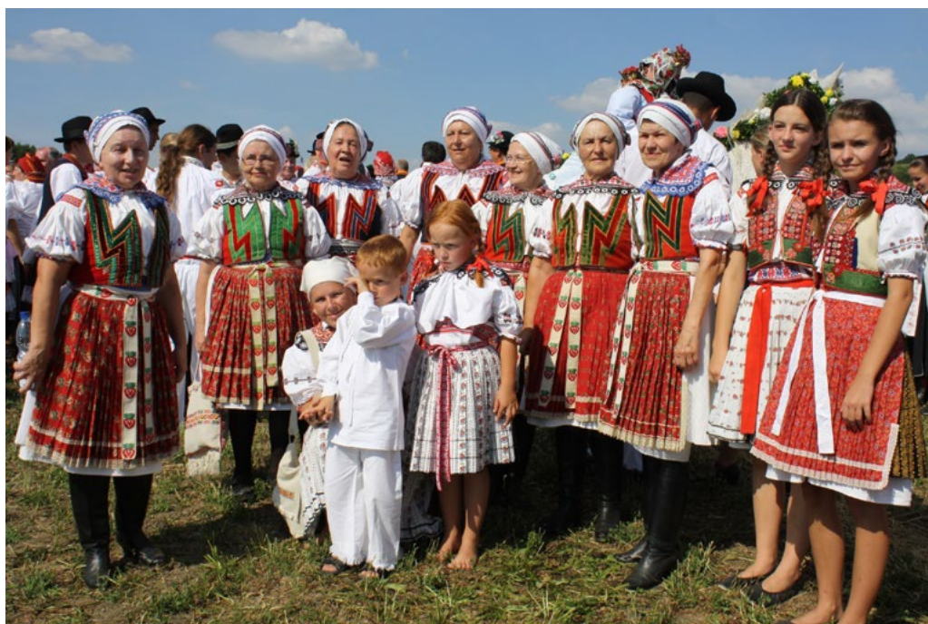
↑ Kroj z oblasti Hornácka.

částek z kvalitních materiálů, ručně vyšíváných, které při správné péči vydrží opravdu dlouho. Jednou se však opotřebí i ty a možná už na světě nebude žádná tetička, která by dokázala vyrobit novou. Snad to ale nastane až v době, kdy budou existovat stroje, které dokáží lidový kroj ve všech jeho variantách vytvořit. Dosud je nutné se při potřebě výroby obrnit trpělivostí. Šití jednotlivých prvků je třeba shánět u různých osob a každá má přitom pořadník čekatelů. Jen v málokterém koutě Slovácka žije někdo, kdo je schopen vyrobit místní kroj kompletně svépomocí. Pak jsou za takovým počinem ukryty týdny práce. Obrovskou zásluhou v zachování řemeslné znalosti je proto existence šicích dílen, které se na výrobu krojů (nejen slováckých) specializují. Najdete je například v Blatniče nebo v Uherském Ostrohu.