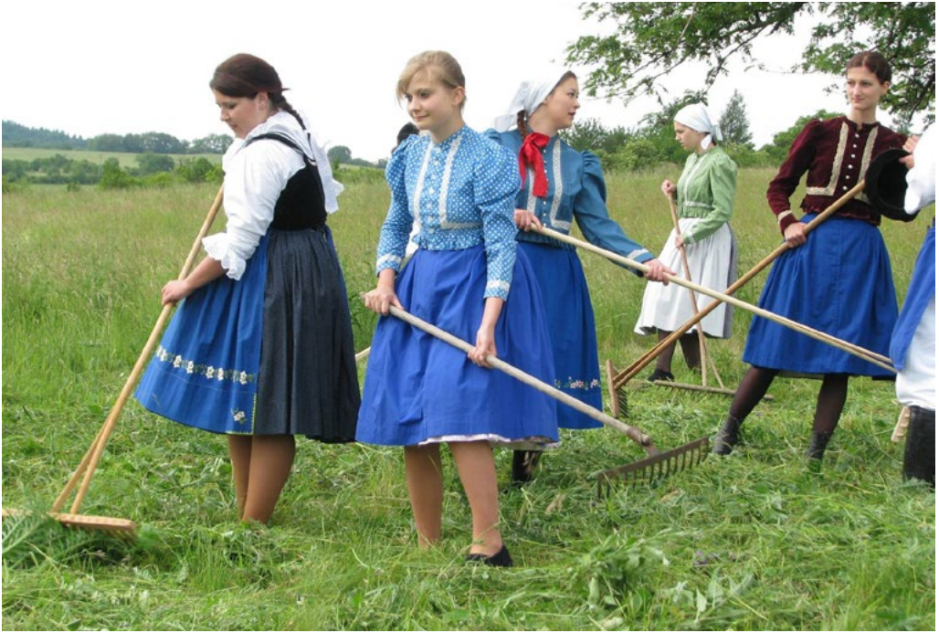
↑ Pracovní verze ženských krojů při ukázce sečení luk u Strážnice.