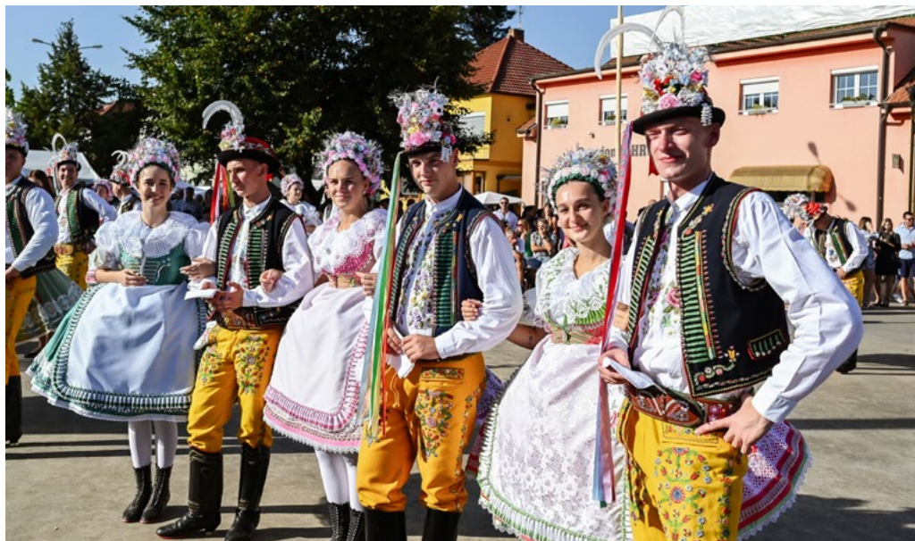
↑ Chasa z Velkých Bílovic v hanácko-slováckém kroji.

přední stranu nohavic uzavírá punt, v němž je vyšívaný šátek. Kolem pasu je dlouhý řemen, zdobený mosaznými bombíky. Na nohou se nosí vysoké boty, holínky.“