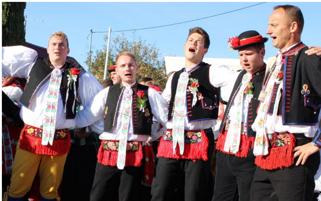
↑ Žádná slavnost na Slovensku, menší či větší, se neobejde bez zpěvu. Jako třeba při hodech ve Vracově.