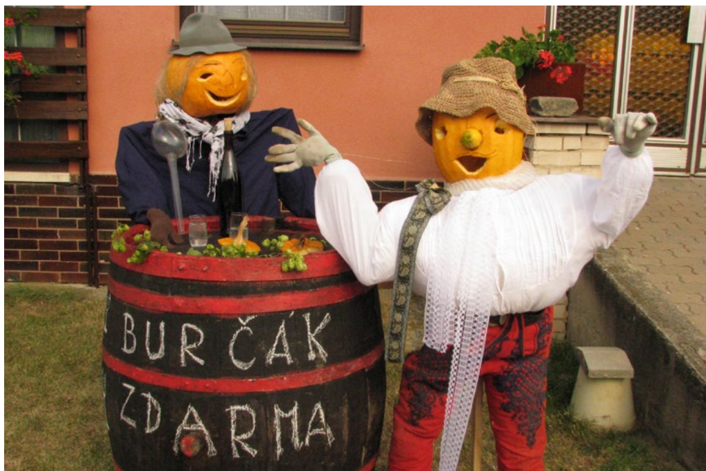
↑ Obyvatelé Starého Poddvorova dokáží ve svých instalacích při tradičním Dýňovém víkendu vystihnout základní charakteristiky Slovenska.