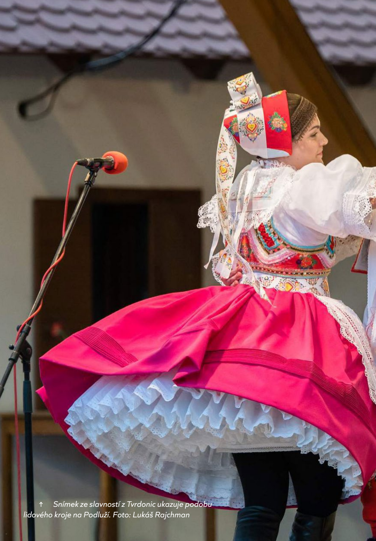
↑ Snímek ze slavností z Tvrdonic ukazuje podobu lidového kroje na Podluží.