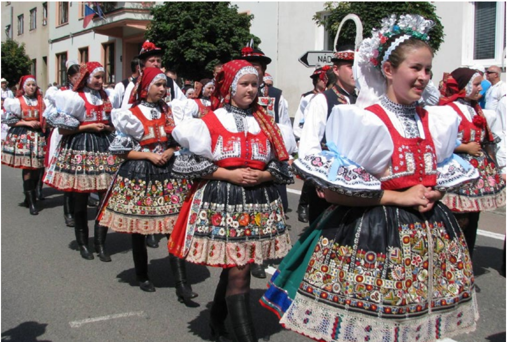
↑ Ženy v kyjovském kroji při průvodu festivalu Slováký rok.