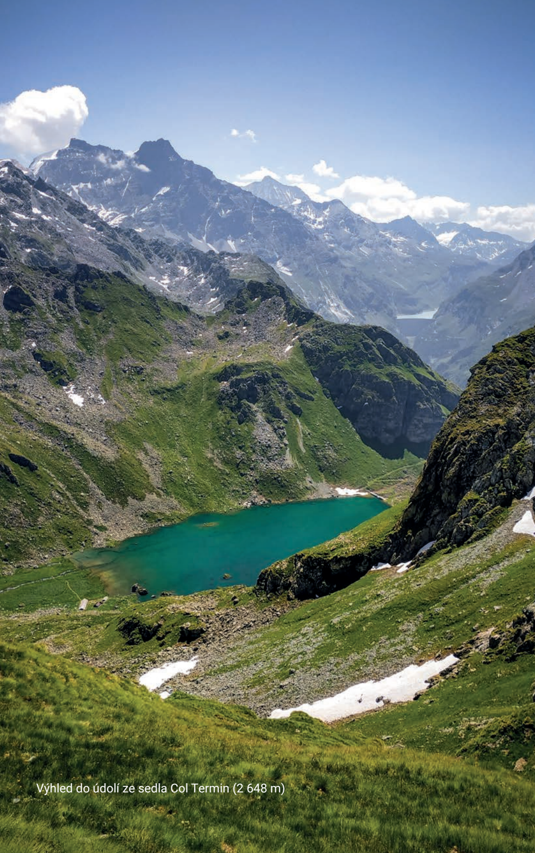
Výhled do údolí ze sedla Col Termin (2 648 m)