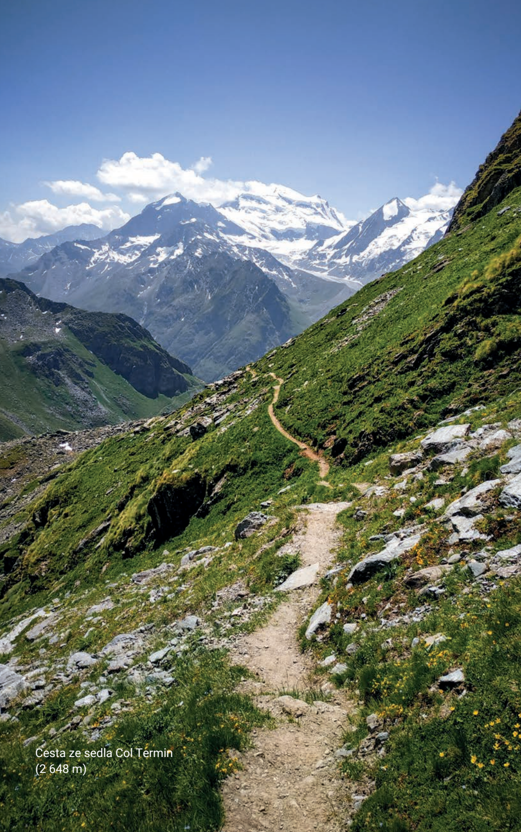
Cesta ze sedla Col Termin (2 648 m)