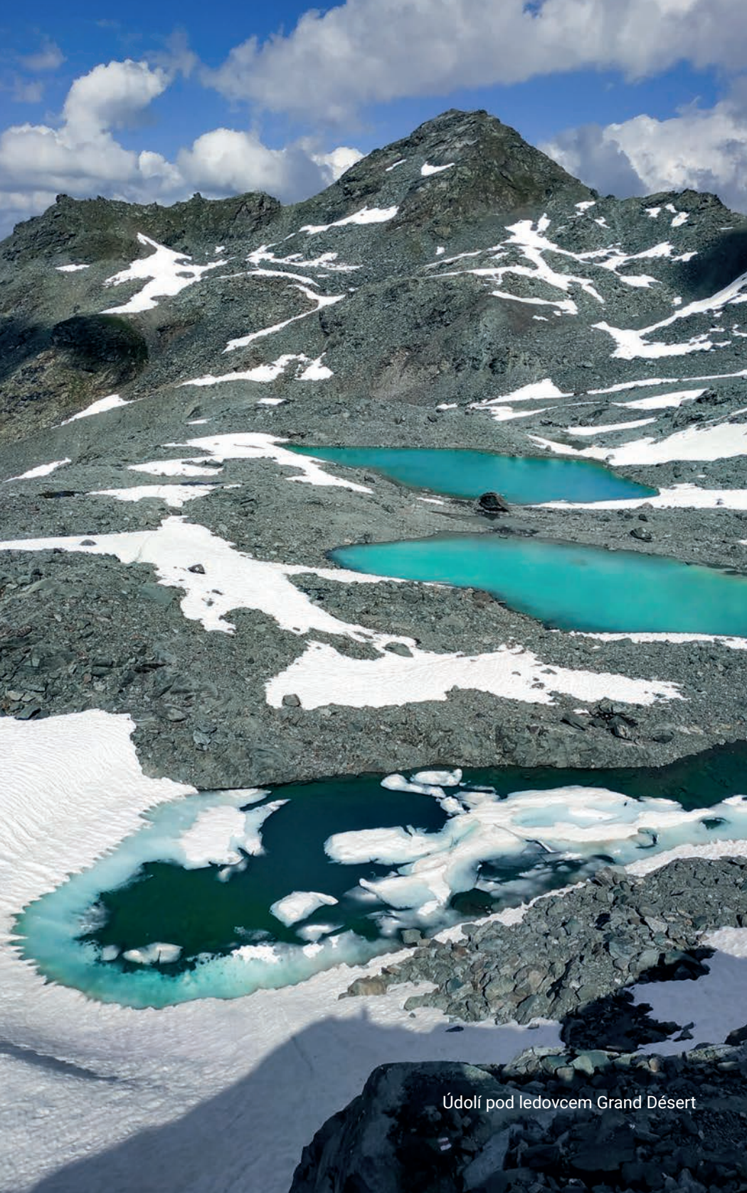
Údolí pod ledovcem Grand Désert