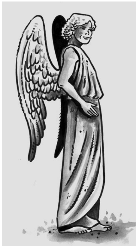
Anděl s křídly v místě těžiště těla

zdořávali všechny překážky a mohli poletovat svobodně a bez zábran vzduchem. Protože se jim nic z toho však nevedlo, nezbylo jim, než aby si takto obdařené bytosti vymysleli a věřili, že jim, lidem, budou naslouchat, pomáhat, poskytovat ochranu a zprostředkovávat spojení s často příliš přísnými až necitelnými bohy.