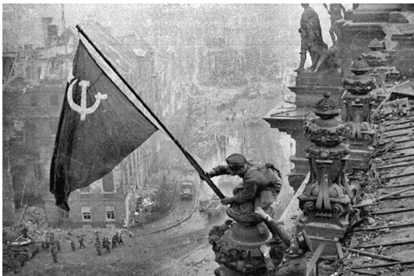
Rudoarmějci vyvěšují rudou vlajku na berlínském říšském sněmu. Scénu zinscenoval 2. května 1945 sovětský fotograf Jevgenij Chalděj.

muži. Zatímco se rudoarmějci se samopaly a ručními granáty probíjávali nahoru po širokém schodišti, obránci se stáhli do podzemí a sklepů.