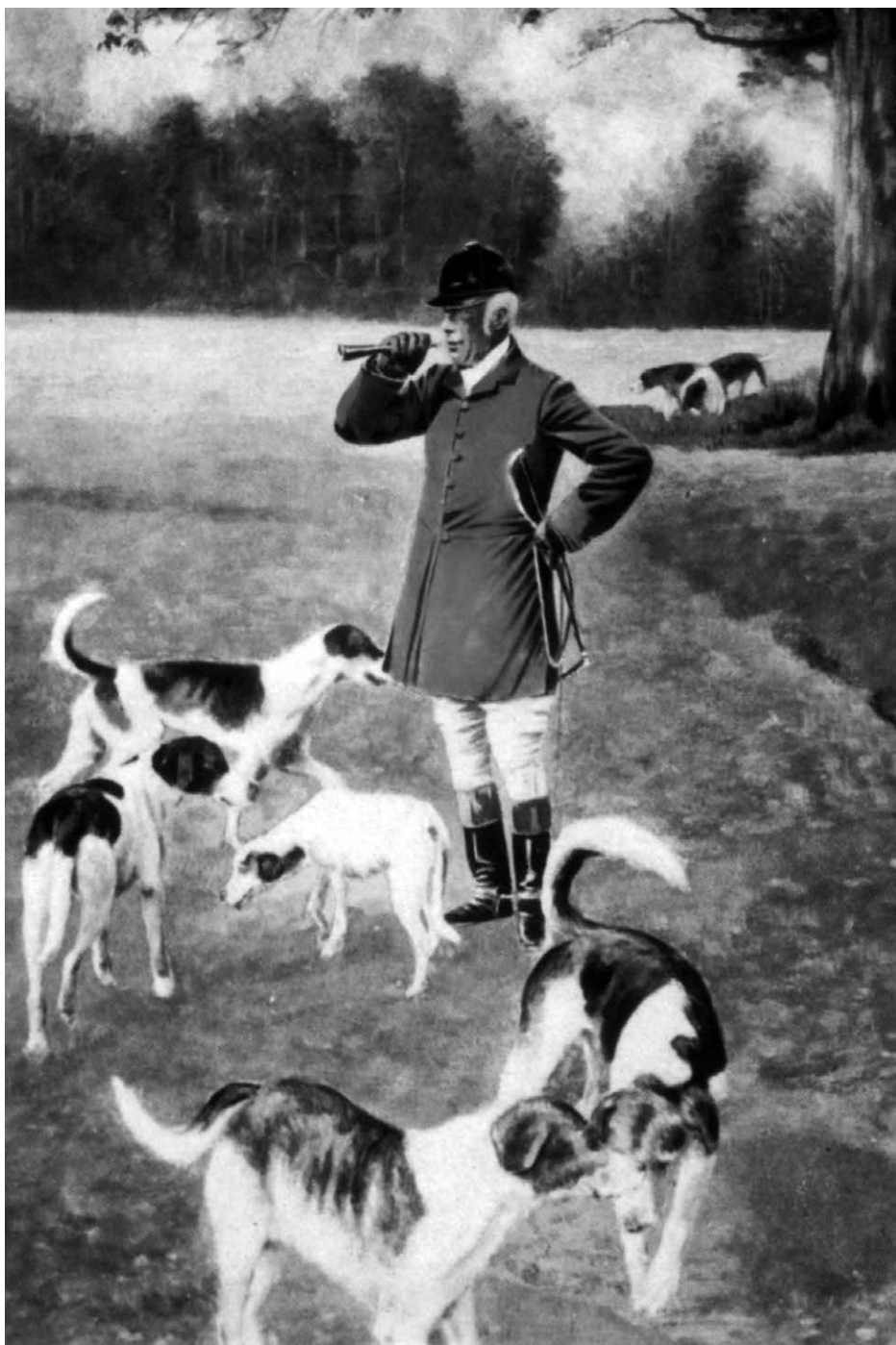
■ Všechno začalo parforními hony...