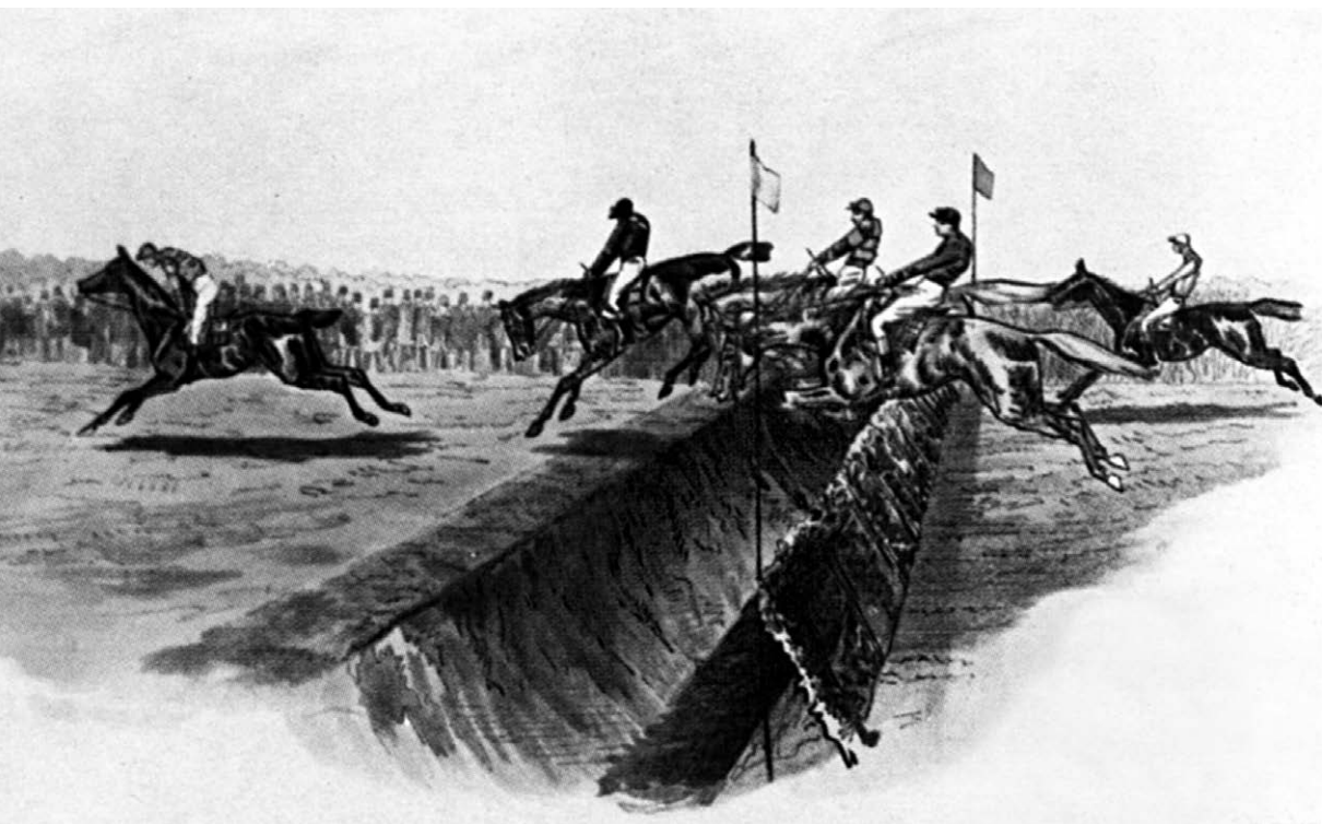
■ Úspěšné zdolání Velkého příkopu v roce 1886 zaznamenal kreslív

Dostih měl velký ohlas v zahraničí a svou náročností vyvolal obdiv po celé Evropě. Nadšení pardubičtí vlastenci mu věštili velkou budoucnost. Zároveň však zazněly i obavy skeptiků, zda se závodistiště nestane jen „novou českou tančírnu pro německé koně“; vítězný Fantôme totiž patřil německému majiteli. Nicméně po skončení prvního ročníku bylo jasné, že se tu musí postavit stáje a sedliště pro koně, tribuny