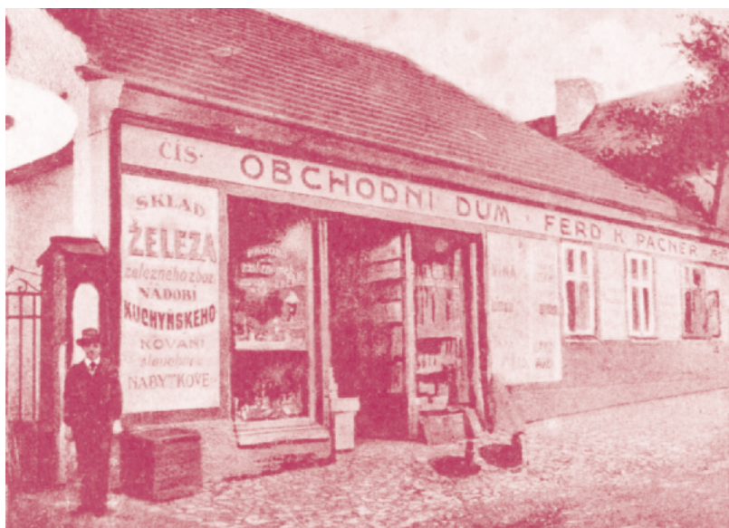
Obchod dědečka a později tatínka v Harantově ulici v Janovicích nad Úhlavou ve dvacátých letech

Tatínek byl zcela zavalený prací, věnoval se jí od rána do večera a na noviny měl čas jen během oběda. Zato já do nich neustále nahlížel a četl si v nich. Začalo to zřejmě