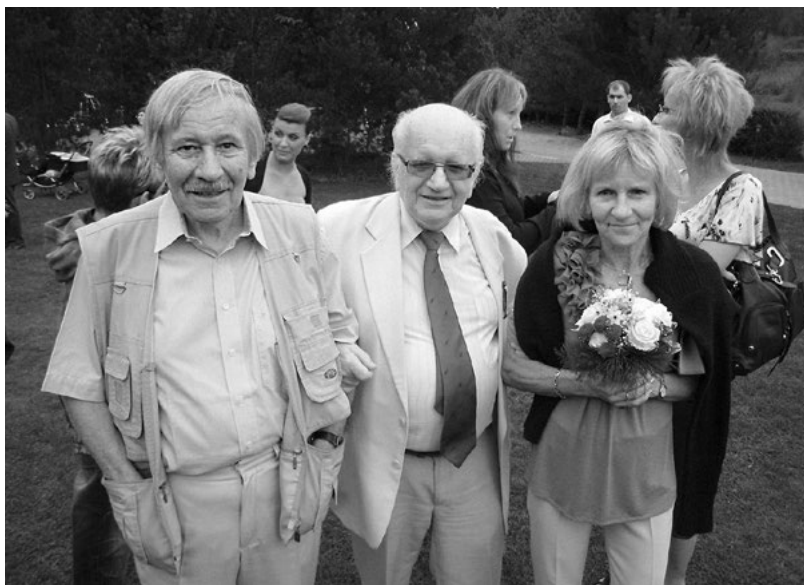
Sourozenci, již zestárlí, opět pohromadě v roce 2011