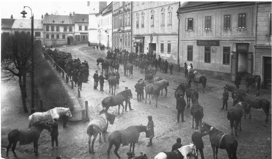
Rekvizice koní v Dačicích

Návrat by pro něj byl nebezpečný, proto se přesunul do Curychu a na půdě neutrálního státu zahájil zahraniční odbojovou činnost. Postupně se tato aktivita stále více točila kolem samostatnosti českých zemí. 51