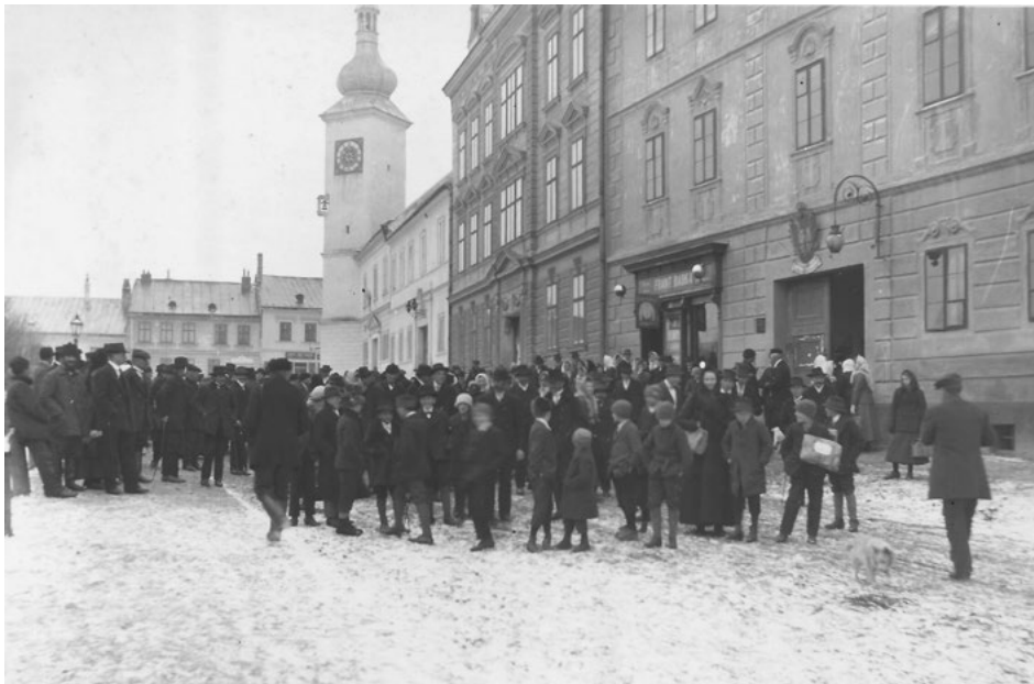
Odvod branců v Dačicích

Většina mužů z Dačicka sice byla zařazena do 81. pěšího pluku, někteří ale byli zapsáni do 14. zeměbranceckého pluku a ojedinelé i do jiných jednotek. 8