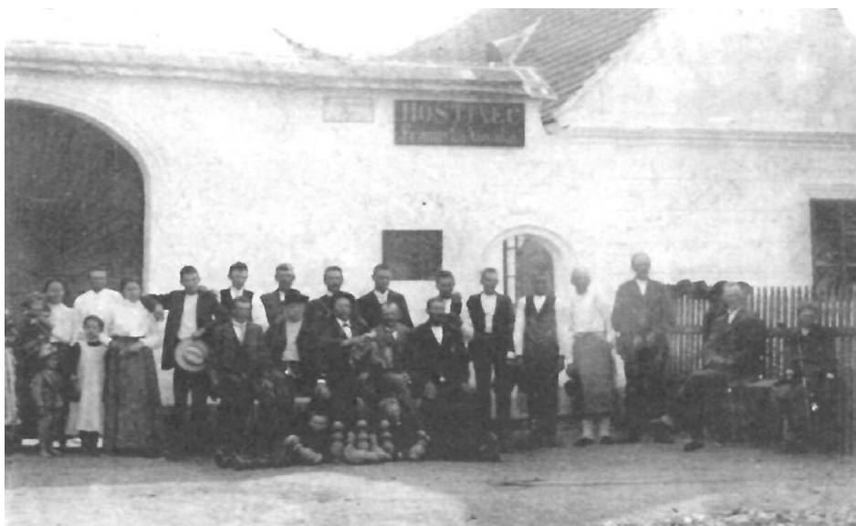
Hospoda v Malém Pěčíně před válkou

Další vlna mrazů přišla na začátku jara, kdy poškodila květy na stromech. Následovalo suché jaro a poté naopak deštivé léto. Výsledkem byla malá úroda obilí, přesto však byla kvalita zrna vysoká.