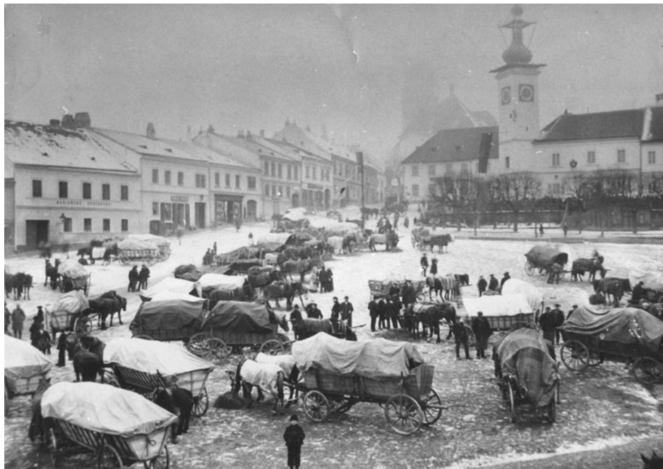
Rekvizice vozů v Dačicích

sledovat pobyty jednotek, protože do adresy nebylo potřeba psát zemi a místo pobytu adresáta. 25