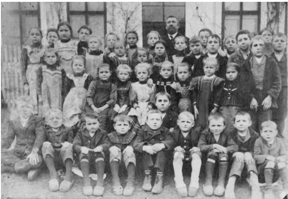
Škola v Malém Pěčíně, rok 1913