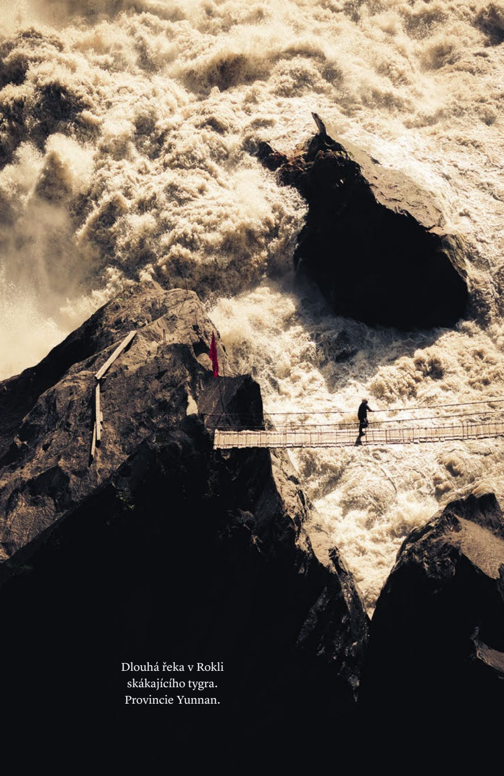
Dlouhá řeka v Rokli skákajícího tygra. Provincie Yunnan.