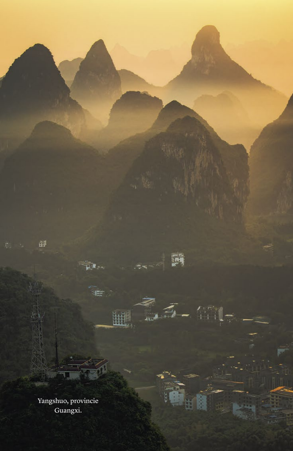
Yangshuo, provincie Guangxi.