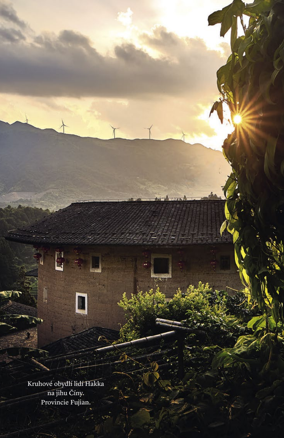
Kruhové obydlí lidí Hakka na jihu Číny. Provincie Fujian.