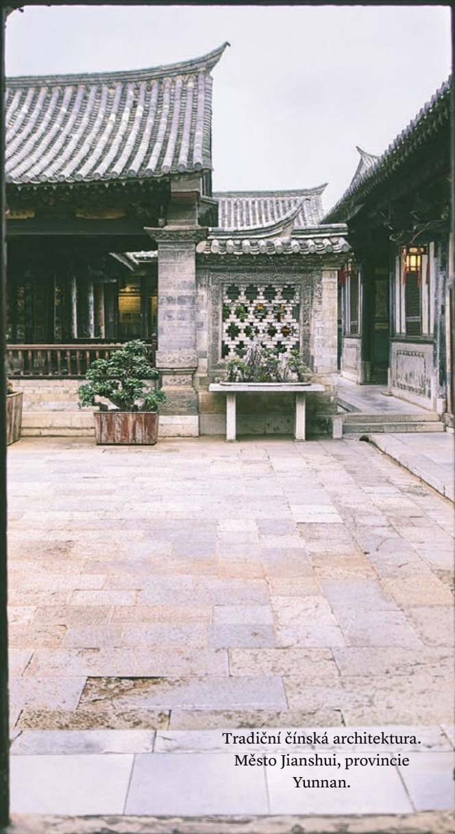
Tradiční čínská architektura. Město Jianshui, provincie Yunnan.