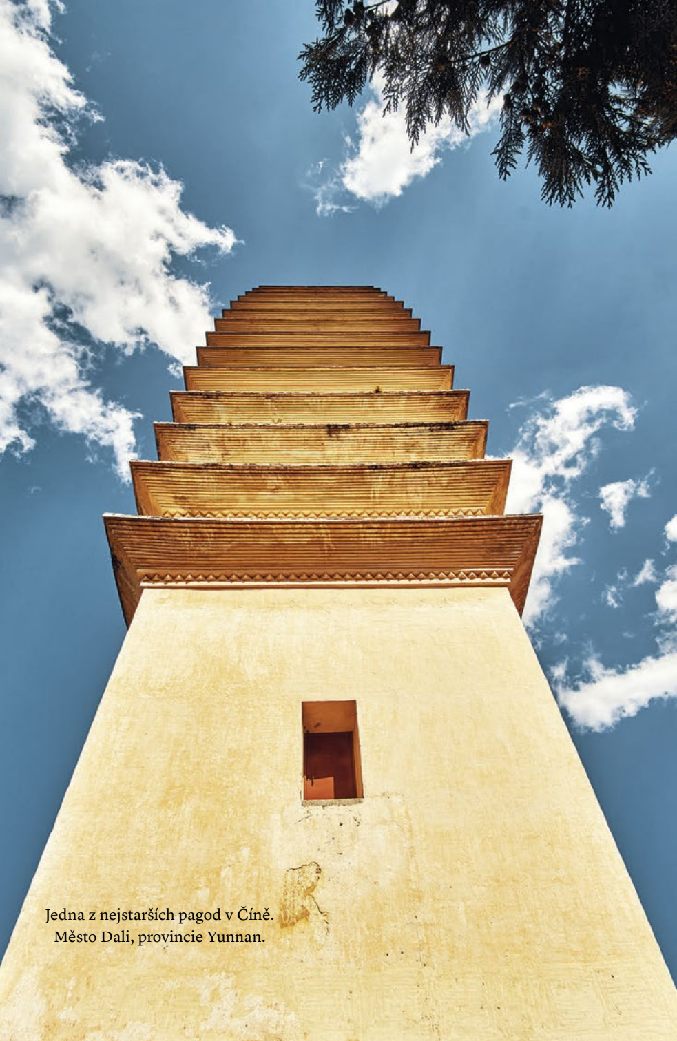
Jedna z nejstarších pagod v Číně. Město Dali, provincie Yunnan.