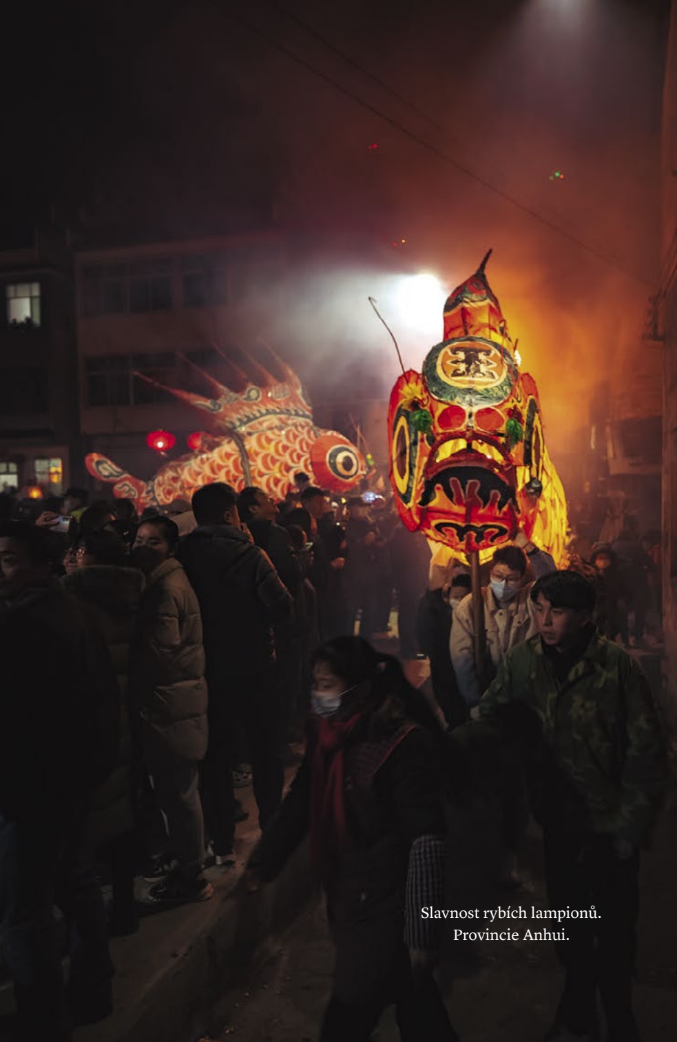
Slavnost rybích lampionů. Provincie Anhui.