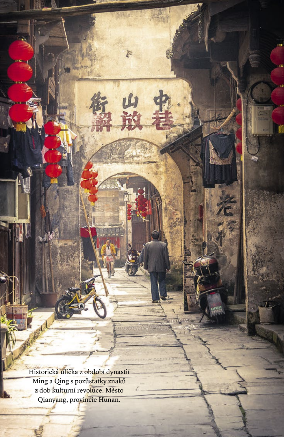
Historická ulička z období dynastií Ming a Qing s pozůstatky znaků z dob kulturní revoluce. Město Qianyang, provincie Hunan.