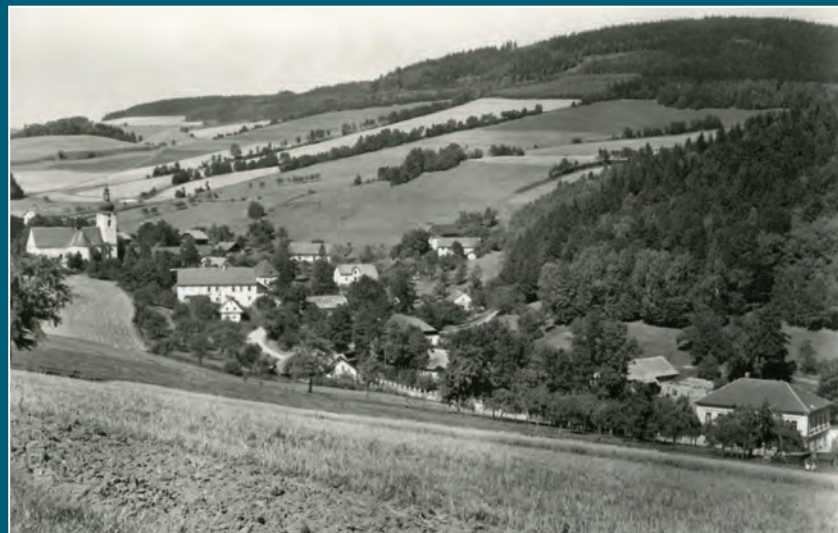
Rejchartice na snímku z meziválečného období a na poválečných pohlednicích z padesátých a šedesátých let 20. století.