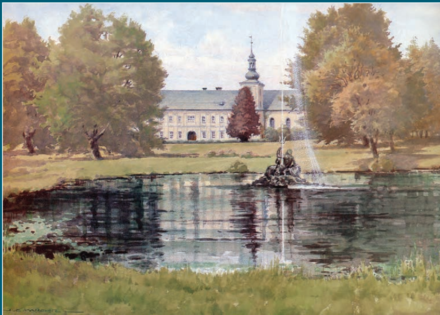
Zámek v Loučňaně nad Desnou a vpravo dřevěný kostel v Maršíkově na akvarelech J. E. Karger, třicátá léta 20. století.

Na první straně údolí Divoké Desné (německými obyvateli Podesní ale nazývané Stille Tess).