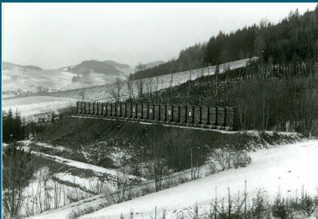
Bratrušovská střelnice v meziválečném období, místo popravы šestnácti severomoravských vlastenců 31. března 1945.