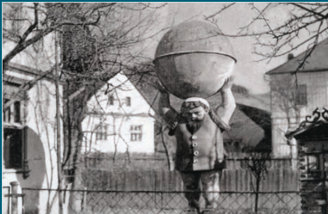
Unikátní včelín v podobě Atlanta stával v Bratrušově v zahradě domu č. p. 43. V roce 1879 ho vyrobil stolařský mistr Johann Schimek. Včelího muže zachytila fotografie ve třicátých letech minulého století, necelé desetiletí od jeho odstranění.