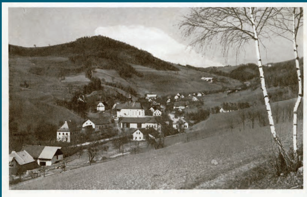
Střed vesnice v první polovině čtyřicátých let 20. století.