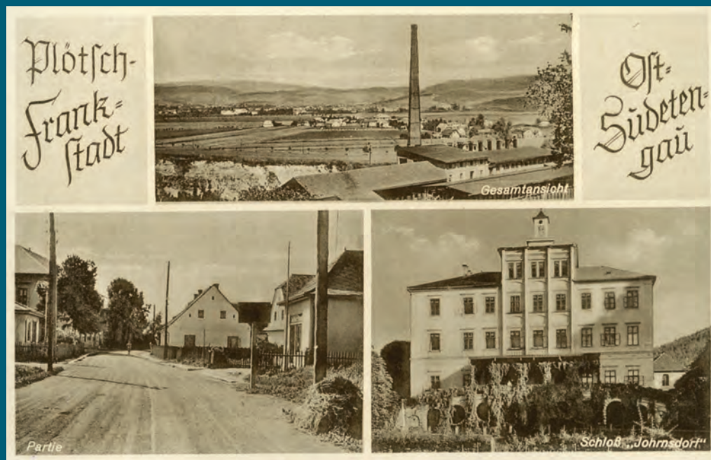
Osada Plechy se zámek v Třemešku, počátek čtyřicátých let 20. století. Na horním snímku pohled na osadu přes střechy dnes již zaniklé kruhové cihelny.

Navracíme se do Frankštátu (Nového Malína) roku 1915. Na kombinované pohlednici bývalá dědičná rychta, poštovní úřad, nová školní budova a nádraží, pod celkovým pohledem na obec náves s kostelem.