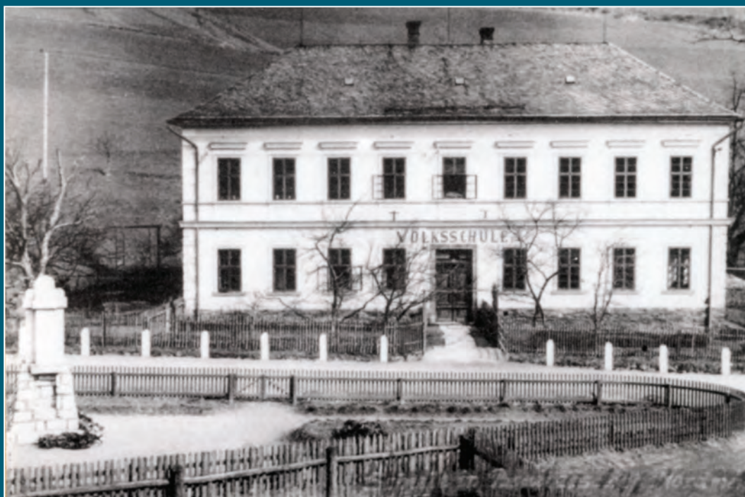
Bratrušovská škola s památníkem obětem první světové války (vlevo).