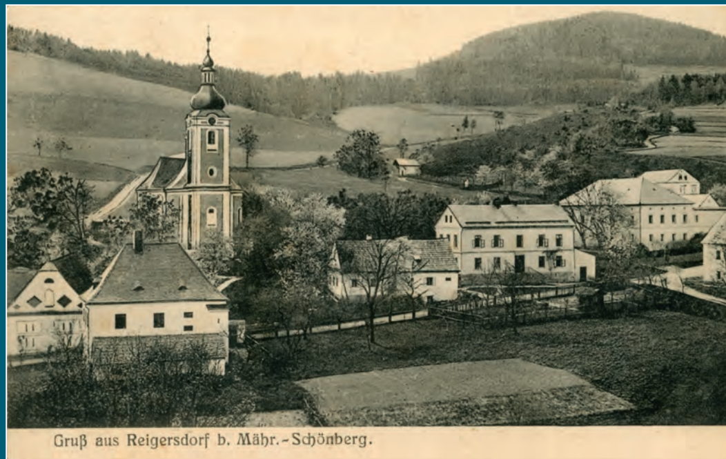
Vesnice v meziválečném období.