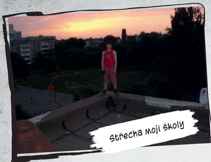
Střecha mojí školy

Tehdy mi bylo sedmnáct a můj týden vypadal nějak takhle: Ve škole jsem končil ve 13:00 a gymnastika mi začínala v 17:00 každý všední den. Měl jsem čtyři hodiny na to, abych udělal domácí úkoly a trochu si odpočinul. A celý víkend jsme venku skákali parkour a freerun. To byl můj obrovský koníček a moc mě to bavilo.