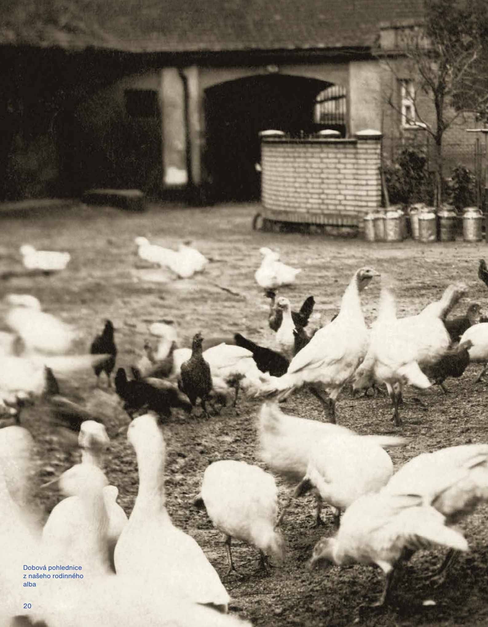
Dobová pohlednice z našeho rodinného alba