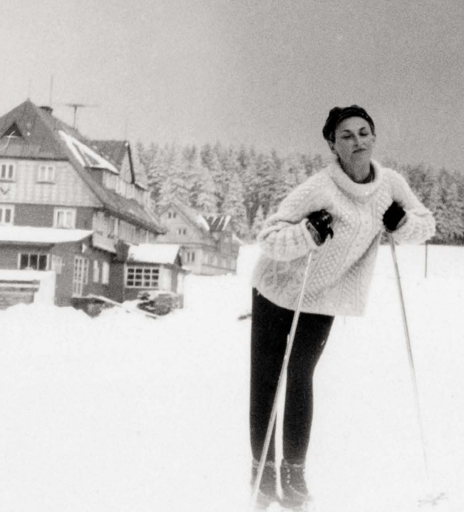
Zamilovaní študáci: maminka s tátou na lyžovačke v Krkonoších