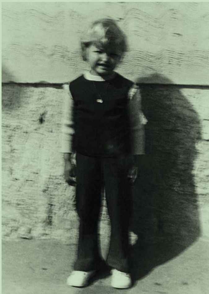
V Suchdole nad Lužnicí, tříletá, obleče- ná „na lepšovku“. Asi jdeme s babičkou do kina.