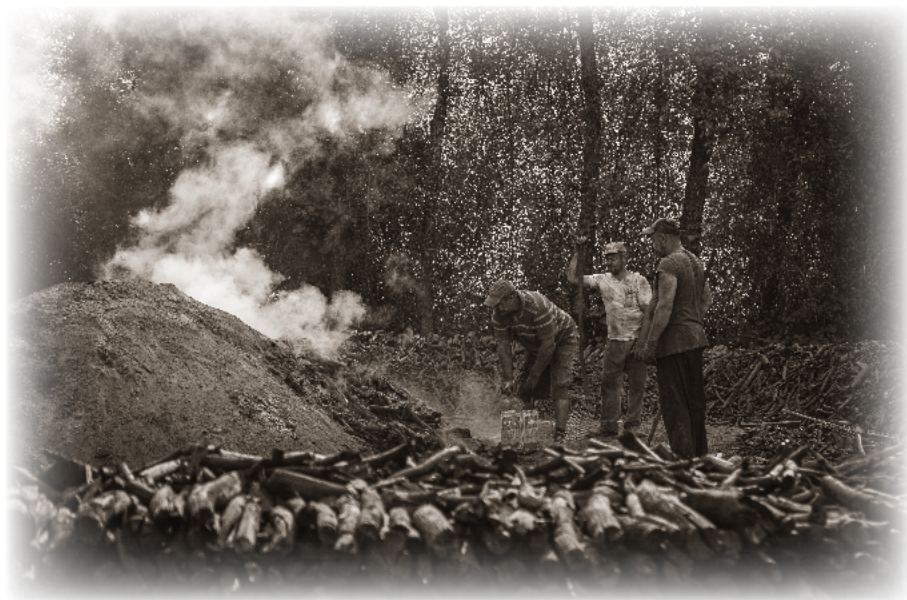
Turečtí uhlíři u rozebraného milíře.

nebo aspoň upravit k novému použití některé z loňských. Odpočívali v jednoduché boudě, kterou si na místě postavili z kmínků, hlíny a mechu. Doprostřed pak zarazili vysoký kůl zvaný „král“ a kolem něj vyskládali nejprve chrastí a pak dřevěná polínka, která jim přidělil hajný. Začínali od středu k okraji, přičemž si nechali prostor na přívod vzduchu, následně vystavěli kolem kůlu dvě až tři vrstvy svisle postavených polen. Když byl milíř připravený, bylo ještě třeba zakrýt ho mechem, zapálit chroští odspoda kanálkem a zakrýt celou kupku hlínou, která bránila přístupu vzduchu – to aby doutnala postupně a pomalu.