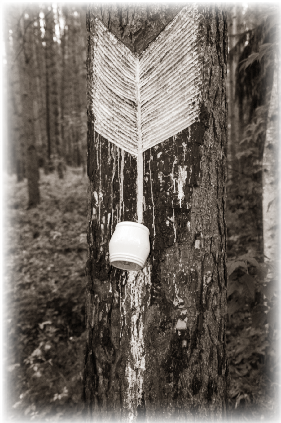
Lizina se zářezy a nádobkou na sběr smůly. Ukázka tradiční technologie, Meklenbursko, Německo.