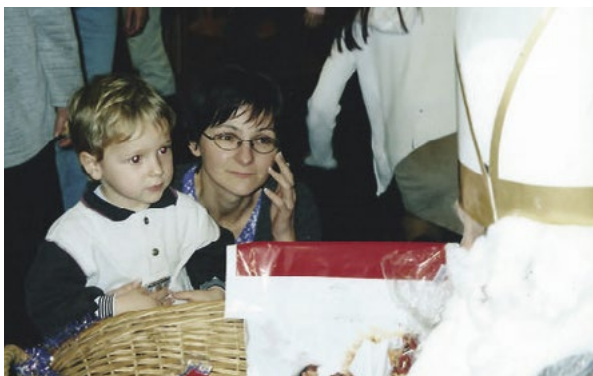
Jeden z prvních kontaktů malého Creepa a Mikuláše.

Když jsme se jednoho dne vraceli se školkou z venkovní procházky, otázel jsem se paní vychovatelky, jaká krmě se bude servírovat ku obědu. Hlasem staré harpyje, kterou paní vychovatelka byla, mi bylo odpovězeno, že buřt. Což byla jediná potravinu, ke které mělo mé tělo averzi. U oběda jsem se tuto informaci snažil harpy... pardon, paní vychovatelce vysvětlit, bylo mi ale řečeno, že sním alespoň pár soust. A tak jsem, po pokusu zkonzumovat jeden kousek onoho buřtu, ozdobil obsah svého žaludku celý stůl. Od té doby jsem již do školky nemusel. U maminky totiž bylo nucení dítěte do jídla na úrovni týrání, neboť si prošla podobnou situací. Ale o tom více pojednává mé video ZVRACEL KVŮLI UČITELCE.