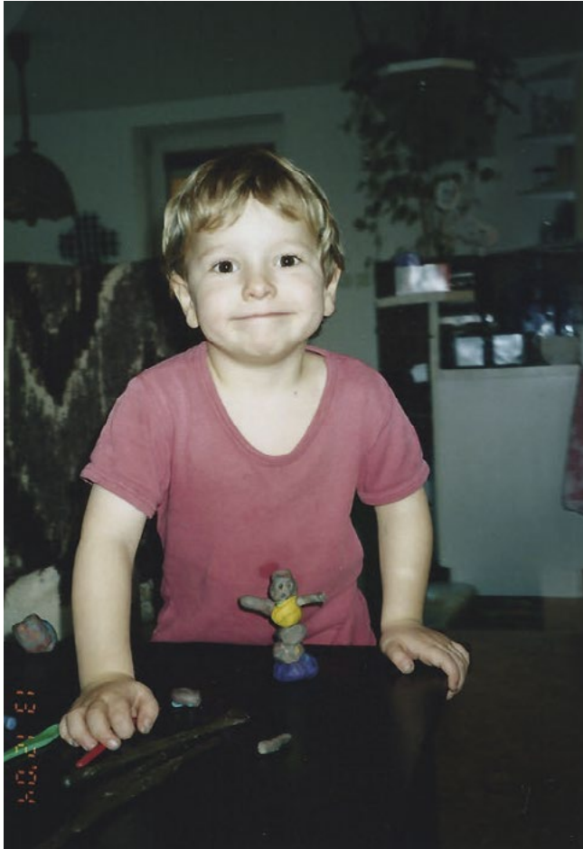
Malý Creep je hrd a pyšen na svůj výtvar z plastelíny.