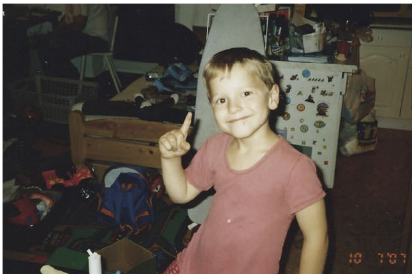
Národním zvířetem Skotska je jednorožec.

Co od téhle knihy čekat? Na následujících stránkách najdeš informace o vývoji mé osoby, historky z natáčení, životní moudra, fotodokumentaci mého pozadí, odpověď na otázku „Proč zrovna želva?“ nebo „Proč zrovna Creep?“ a spoustu dalších věcí, které jsem sdílel pouze minimálně nebo vůbec, protože je chci věnovat pouze vám, čtenářům mé historicky první knihy. Víte, co je nejlepší? Já ještě pořád nevím, jak se bude jmenovat. Tak to snad během psaní nějak vymyslím. Toto dílo je do značné míry reprezentací mého uvažování. Je rozděleno na jednotlivé myšlenky a často vám nemusí dávat smysl. A je to tak naprosto v pořádku.