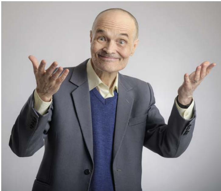
Úsměv – stačí málo a častěji

V běžném životě se většinou nemůžeme hlasitě chechtat, řehtat, popadat se za břicho a svíjet smíchy. To ani není třeba, stačí, když se budeme více usmívat.