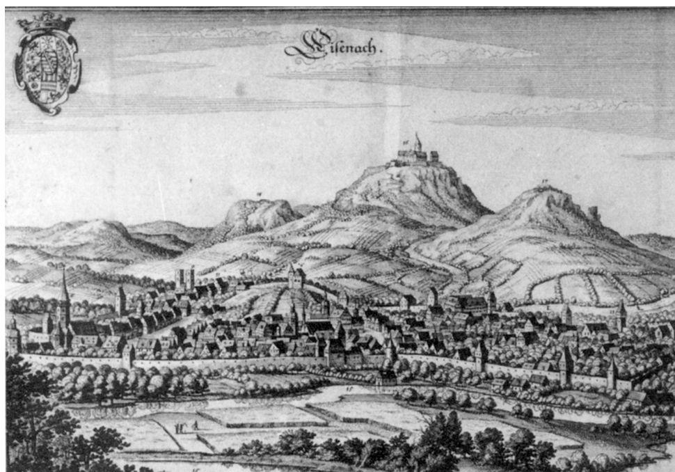
Pohled na Eisenach. Rytina z knihy Matthäuse Meriana Topographia , 1650.