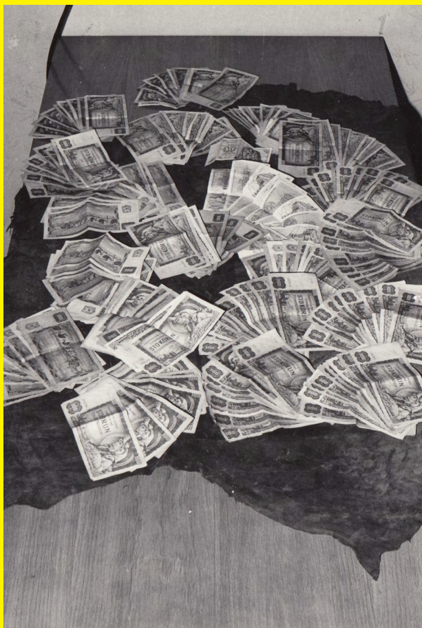
Bankovky zabavené překupníkům při domovní prohlídce, 60. léta.