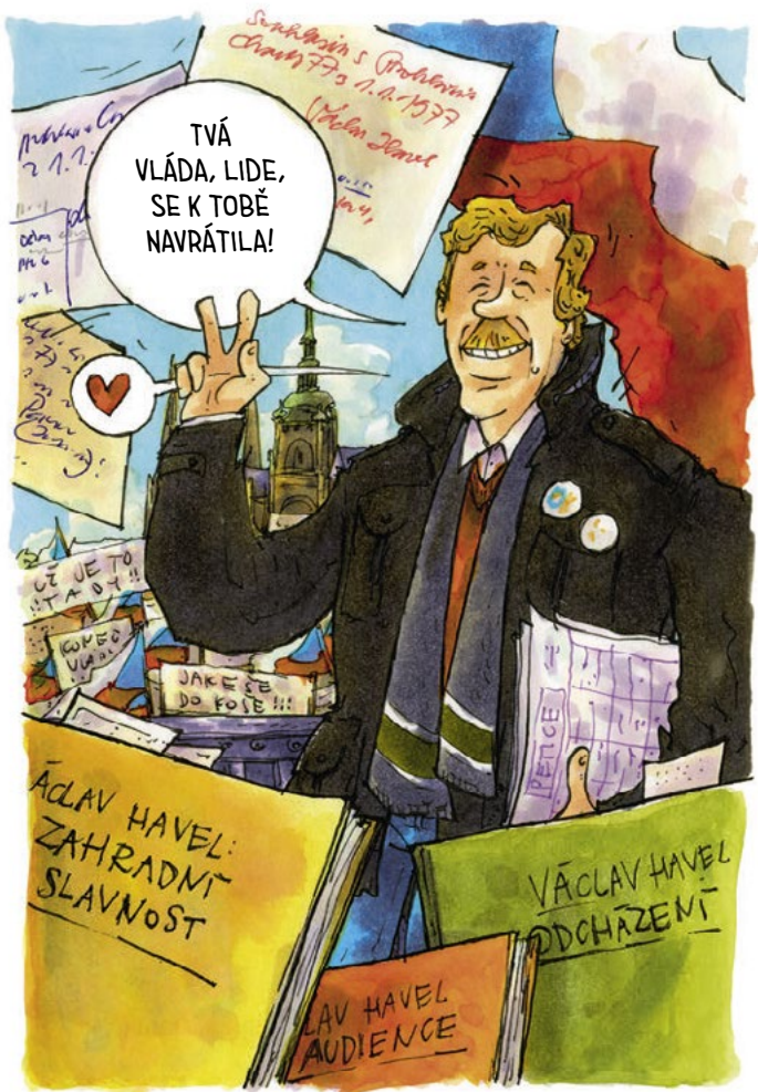
Nakreslil Tomáš Chlud