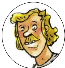
VÁCLAV HAVEL (1936–2011), dramatik, spisovatel a prezident