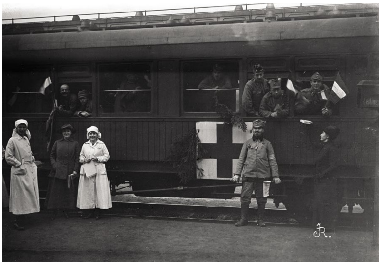
Sanitní vlak rakousko-uherské armády v první světové válce

V každém vlaku pracovali v rámci zdravotního zabezpečení dva lékaři a šest ošetřovatelů. Uvádí se, že do 31. srpna 1918 převezly vlaky z bojišť 359 945 zraněných. Řádoví lékaři provedli během války 27 163 operací. V zázemí provozoval řád několik nemocnic a rehabilitačních ústavů.