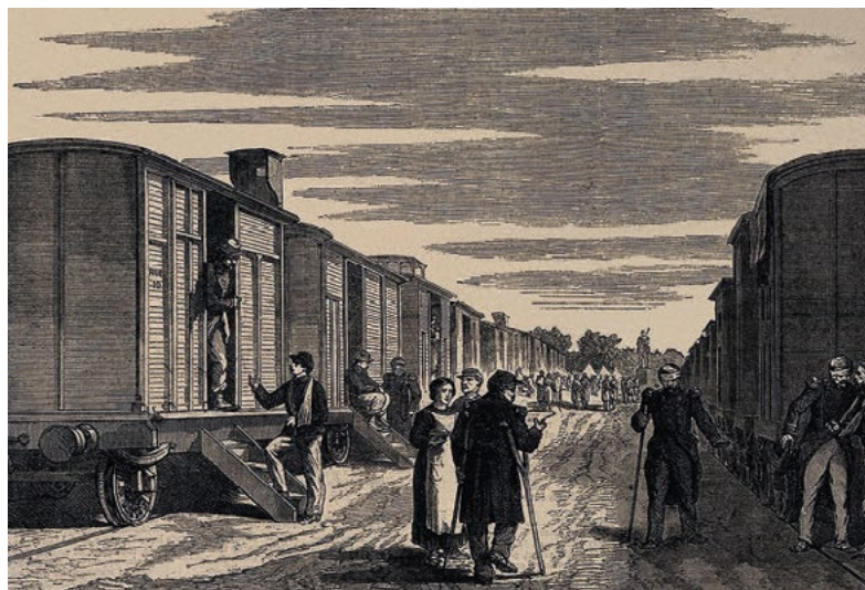
Prusko-francouzská válka – železniční vagony použité jako sanitní vozy

Pruské výboje v letech 1866–1871 byly prvním globálním konfliktem na evropském kontinentu,