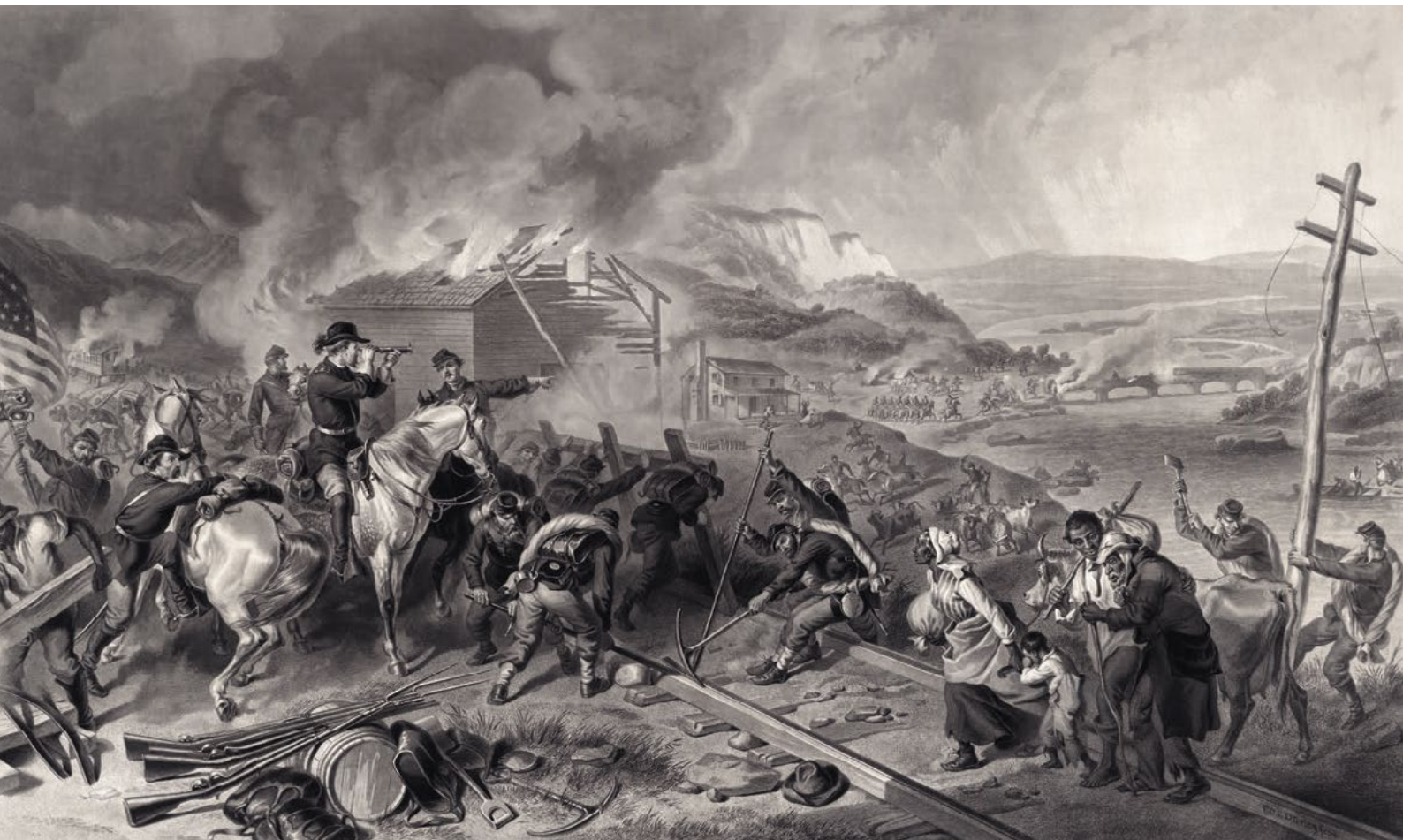
Americká občanská válka Severu proti Jihu, ničení železničních tratí vojsky Unie

což byla koalice jedenácti amerických států, které se chtěly od Unie odtrhnout. Jelikož státy Konfederace byly soustředěny v jihovýchodní části Unie, nazývá se tato válka také válkou Severu proti Jihu. Výhod železnice využívaly obě bojující strany. Hromadné využití vlaků pro přepravu vojska a výzbroje bylo zaznamenáno v americké občanské válce hlavně na průmyslovém Severu. Před bitvou u Gettysburgu v červenci roku 1863 převážely některé oddíly Unie vlaky plné dělostřelectvo. Válka trvala poměrně dlouho a stále neměla vítěze. Nakonec rozhodlo lepší průmyslové zázemí a organizace Severu. Organizace tak bezohledná, že se zaměřila na ničení mostů, uzlových stanic a železničních dep. Takové ztráty nemohl převážně zemědělský Jih v krátké době nahradit, a po několika porážkách tedy kapituloval.