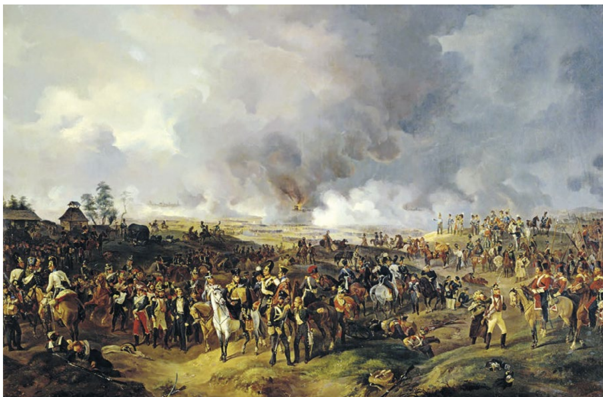
Napoleonské války – Bitva národů u Lipska

Na potíže se zásobováním doplatil také Napoleon během svého tažení do Ruska. Rusové uplatnili během ústupu taktiku spálené země, a tak francouzské armádě selhalo zásobování z místních zdrojů. Po vypálení Moskvy ho donutili ustupovat stejným územím a tragédie Francouzů byla dokonána. Do vlasti se vrátila méně než polovina mužů. Závěrem je možné konstatovat, že napoleonské války byly posledním velkým válečným konfliktem, který proběhl před érou železnice.