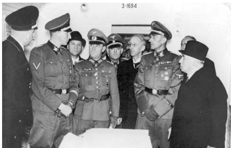
Předání sanitního vlaku Lazarettzug Nr. 751 – interiér vaku, operační vůz

darovala protektorátní vláda Adolfu Hitlerovi kompletní sanitní vlak sestavený v dílnách ČMD v Bubnech z vozů odebraných z provozu. Sanitní vlak byl označený jako Lazarettzug Nr. 751.