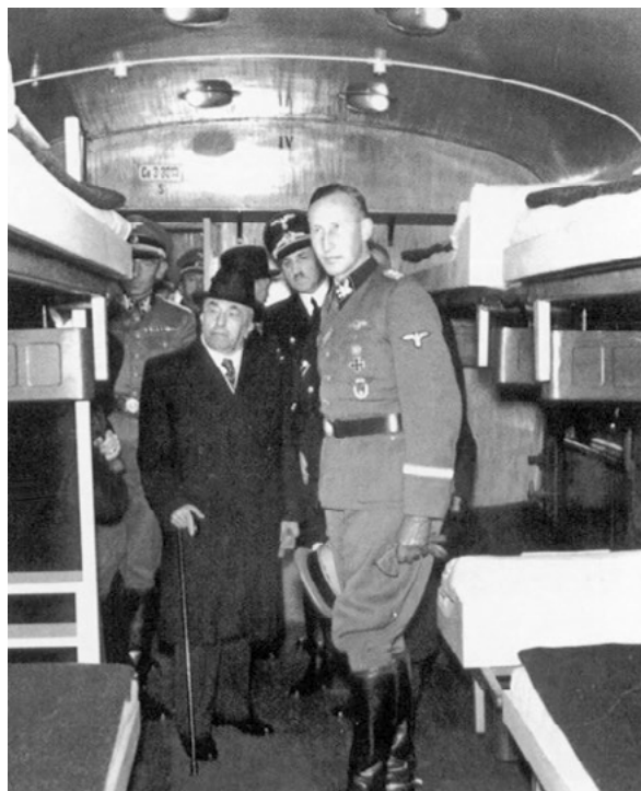
Předání sanitního vlaku Lazarettzug Nr. 751 – interiér vozu pro raněné, v popředí R. Heydrich, Judr. E. Hácha

darovala protektorátní vláda Adolfu Hitlerovi kompletní sanitní vlak sestavený v dílnách ČMD v Bubnech z vozů odebraných z provozu. Sanitní vlak byl označený jako Lazarettzug Nr. 751.