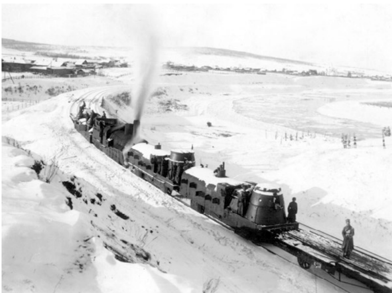
Obrněný vlak československých legií „Orlík“ u Irkutsku

vagony i obrněné lokomotivy. Obrněné vlaky se staly poměrně rozšířenými již během první světové války. Bojovali na nich i českoslovenští legionáři při své sibiřské anabázi. Před druhou světovou válkou měla československá armáda několik obrněných vlaků, nejvíce rozšířeny však byly v Sovětském svazu, Polsku a Německu. Svůj vrchol zažily obrněné vlakové soupravy v druhé světové válce, přičemž svoji roli sehrály např. ve Slovenském národním povstání a také v květnovém Pražském povstání. Po ukončení války byla obnovena v Milovicích rota obrněných vlaků, která podléhala velitelství tankového vojska. A v polovině 50. let minulého století přestaly být obrněné vlaky součástí výzbroje jednotlivých armád.