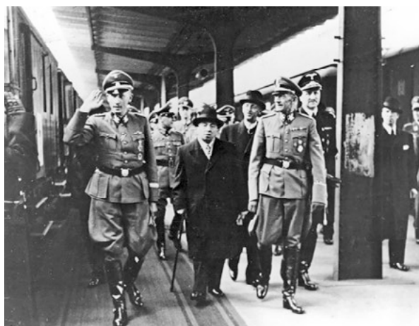
Předání sanitního vlaku Lazarettzug Nr. 751 na pražském hlavním nádraží, v popředí R. Heydrich, JUDr. E. Hácha, K. H. Frank

Svoji roli sehrály sanitní vlaky i během druhé světové války. Používaly je armády všech válčících stran v Evropě. Za zmínku stojí skutečnost, že v dubnu 1942, u příležitosti vůdcových narozenin,