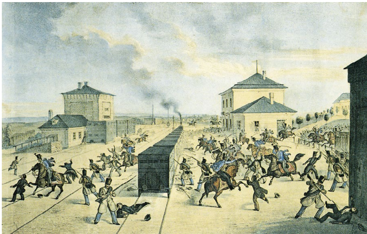
Revoluční rok 1848 – Přepadení vlaku s povstalci v Běchovicích

Prusko-rakouská válka v roce 1866 se již nesla ve znamení hromadného zapojení železnice do válečných událostí. Na začátku konfliktu ukrylo Sasko, spojenec Rakouska, převážnou část svých lokomotiv a železničních vozů v severozápadních Čechách. Po prohrané válce se Sasko stalo spojencem Pruska a lokomotivy se musely vrátit zpět.