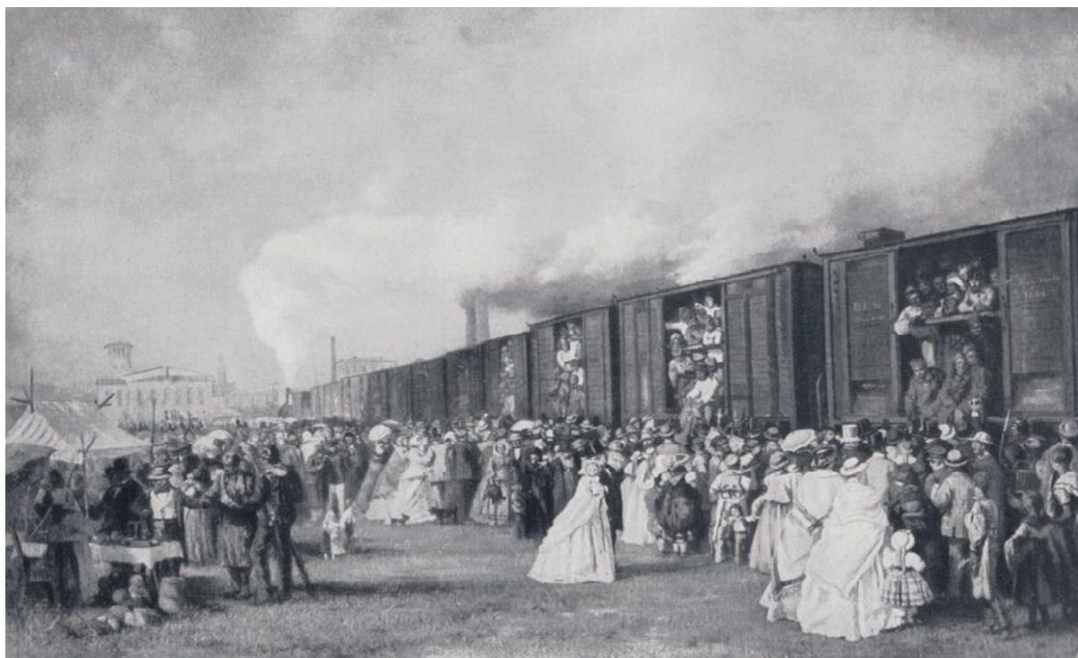
Prusko-rakouská válka – nástup pruského vojska do vlaku v Breslau

Konflikt netrval dlouho a dne 3. července dosáhli Prusové rozhodujícího vítězství v bitvě u Hradce Králové. To jim umožnilo obnovit zásobovací linie a postupné pronásledování rakouských a saských armád. Po porážce u Hradce Králové použilo rakouské vojsko železnici k ústupu na Moravu. Přesto postupující jízdní pruské sbory byly rychlejší a přerušily železniční spojení s Vídní, a Severní armáda tedy byla odříznuta. Válka byla v podstatě rozhodnuta a 22. července zahájily obě strany v Mikulově jednání o příměří. Dne 23. srpna podepsaly v Praze mírový protokol.