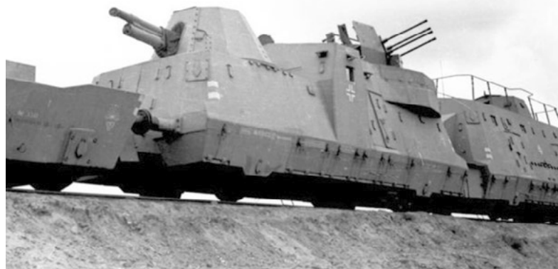
Obrněný vlak wehrmachtu na východní frontě