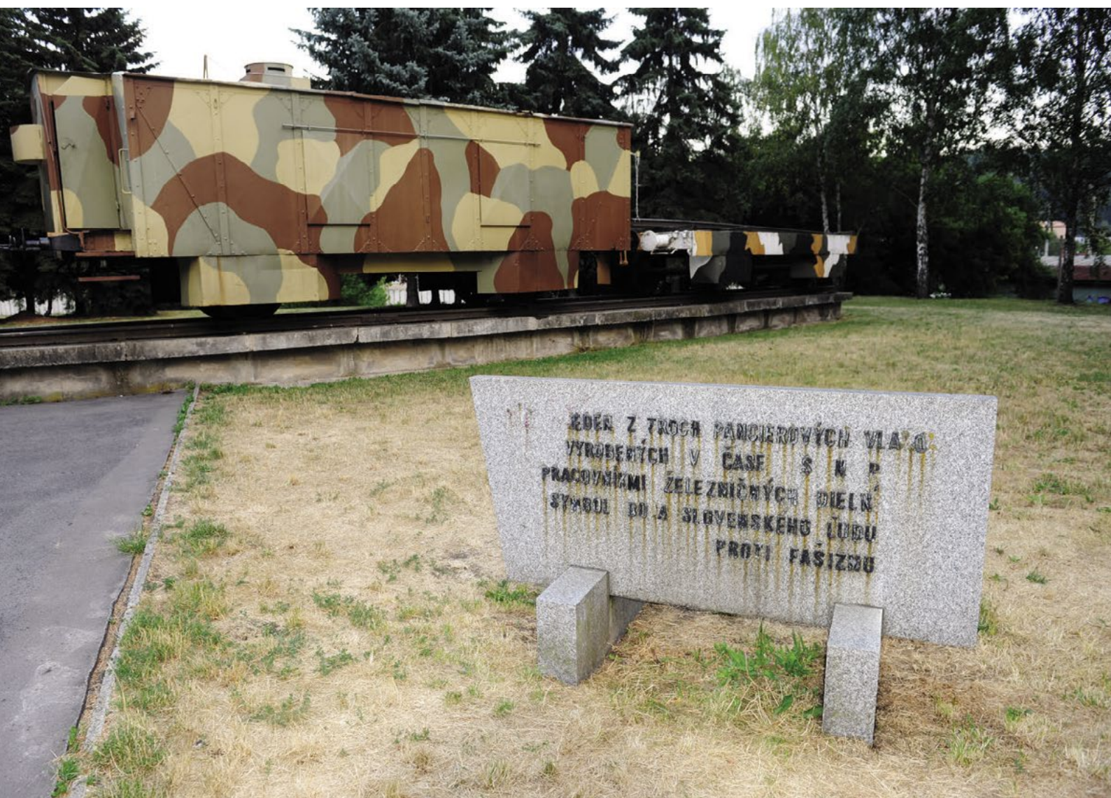
Předběhový a kulometný vůz improvizovaného obrněného vlaku Štefánik z dob SNP vystavený ve Zvolenu