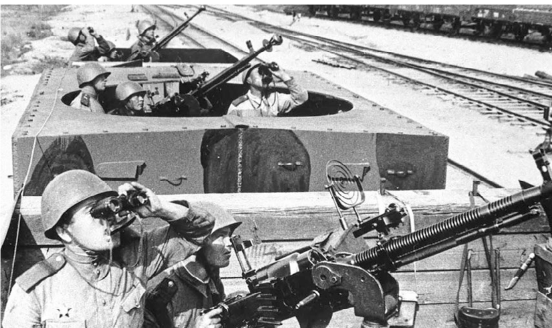
Protiletadlový vůz obrněného vlaku Rudé armády