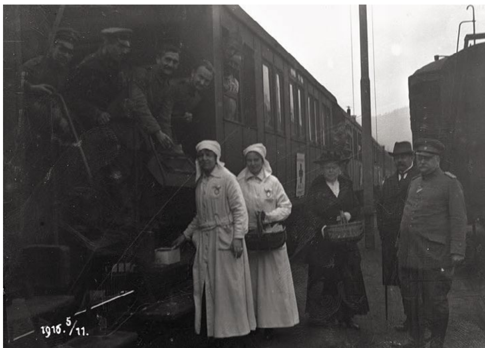
Sanitní vlak německé armády v první světové válce