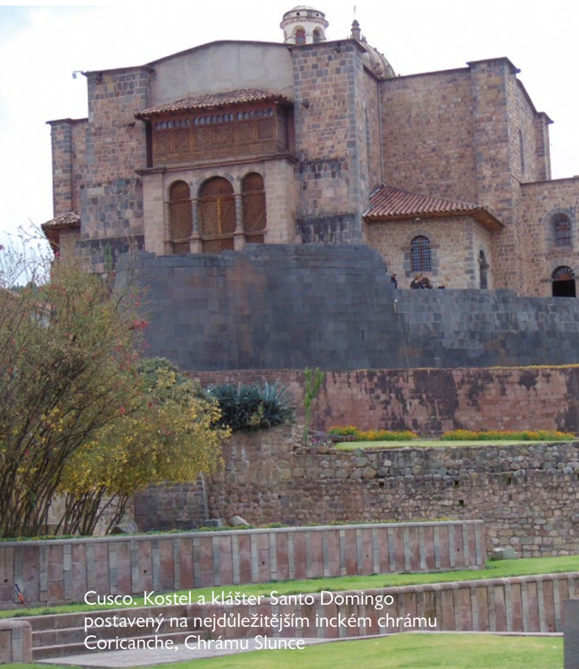
Cusco. Kostel a klášter Santo Domingo postavený na nejdůležitějším inckém chrámu Coricanche, Chrámu Slunce