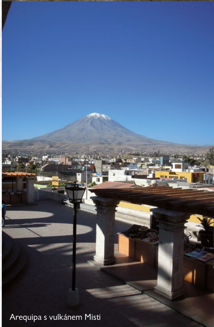
Arequipa s vulkánem Misti