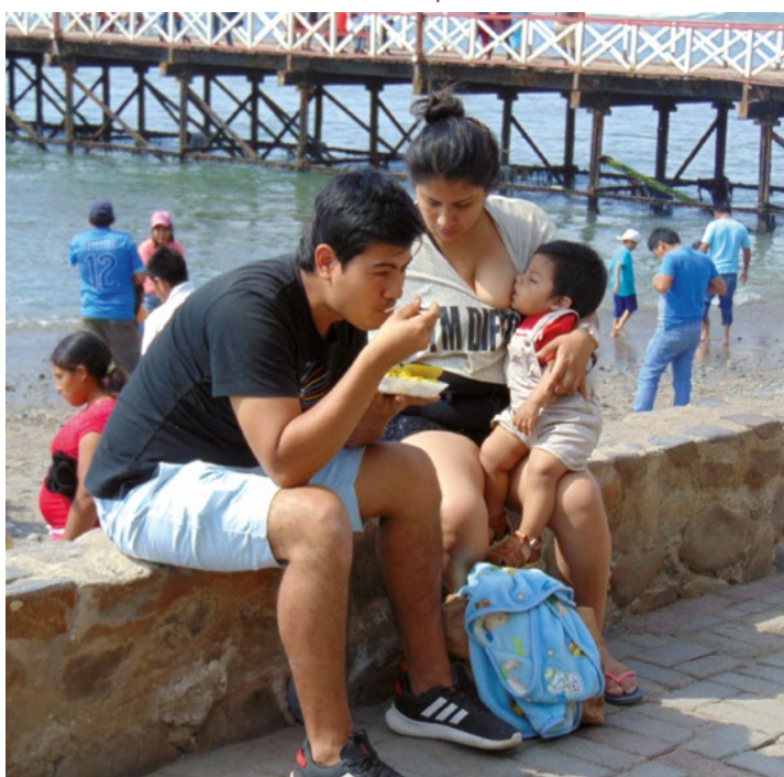
Mladá mestická rodina na nedělní procházce

Další početnou skupinou jsou indiáni. Sem zahrnujeme nejenom ty tzv. „čistokrevné“, kterých je velmi málo, jenom asi 5 %, ale počítáme k nim všechny obyvatele, u nichž převažuje indiánská krev. Ti pak tvoří asi 33 % veškerého obyvatelstva. Nejpočetnější skupinu tvoří andštití indiáni národa Quechuů a Aymarů. K nim musíme ještě