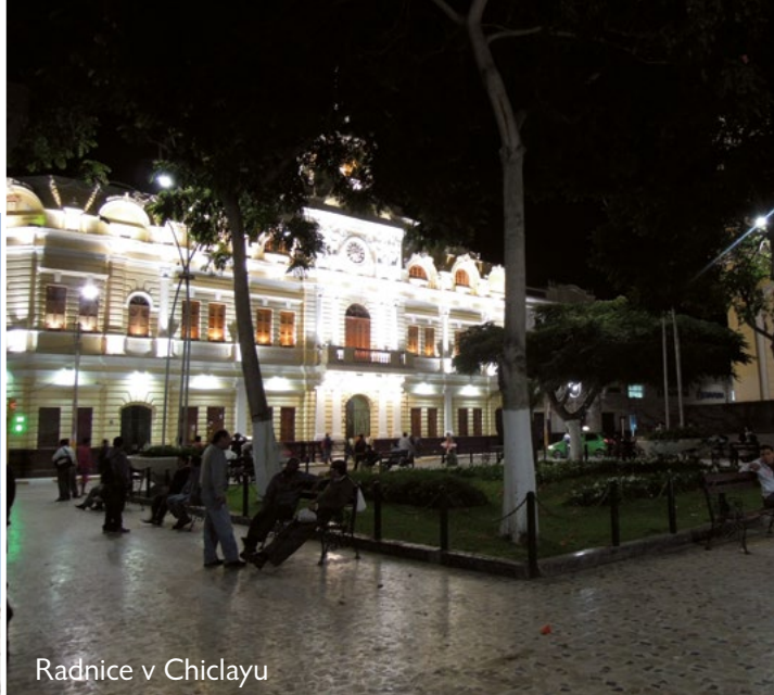
Radnice v Chiclayu