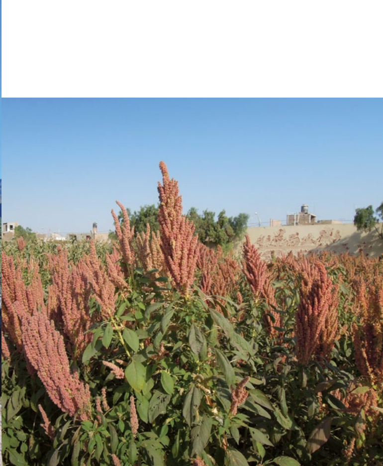
Pole se zrající kiwichou