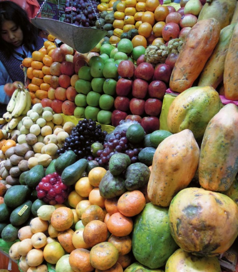
Na každém trhu se prodává mnoho ovoce