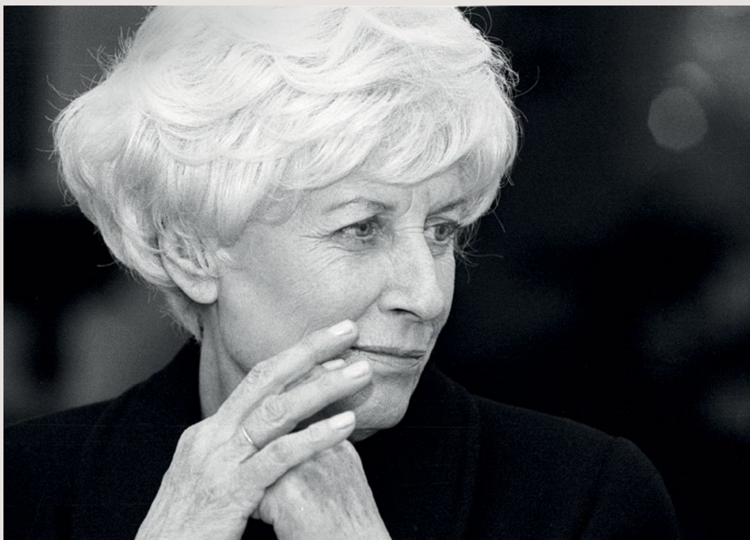
Olga Havlová

Pokud jde o zdraví, drobným problémům Kohouti neuniknou, ty závažnější se jim spíše vyhýbají. Pozor by si měli dávat především na trávení. Jsou vybíraví, měli by se však vyhýbat přejídání a nezdravým pokrmům. Na zažívání mohou mít vliv i výkyvy nálad, kterým často podléhají.