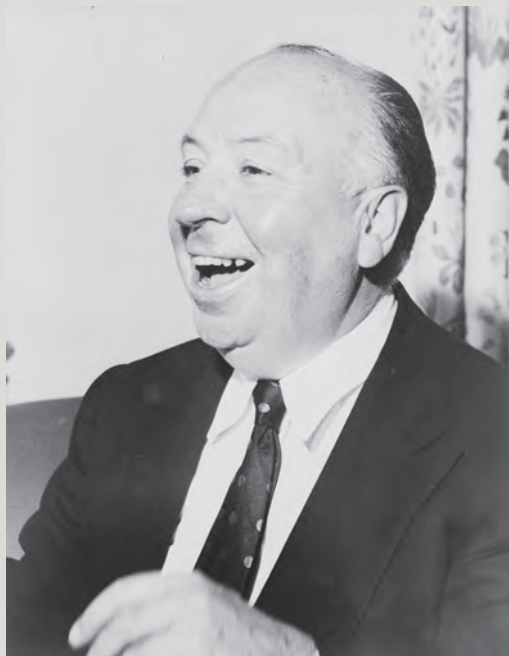
Henry Kissinger Ernest Hemingway Elon Musk Alfred Hitchcock