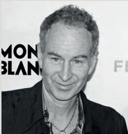
Hugh Laurie Suzanne Vega Kevin Spacey John McEnroe