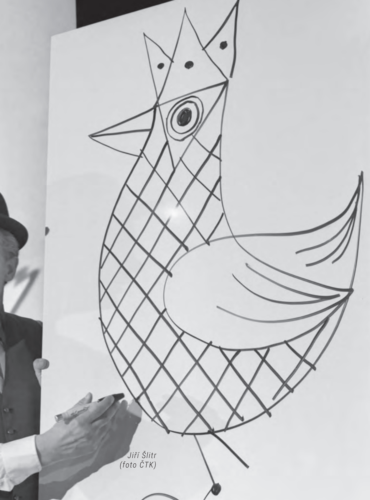
Jiří Šlitr