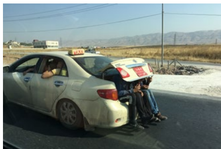
Severní Irák. Mobilní „babybox“ pro početné rodiny.

ma nad ubíhající vozovkou. Odškrtnutý mám i tříhodinový průjezd New Yorkem v páteční špičce, s jediným vodítkem v podobě mapky o velikosti A5 z letištní půjčovny, položené na sedadle spolujezdce. S exmanželkou nás kdysi z Amsterdamu až do Prahy provázela vánice, jež přesně kopírovala směr našeho přesunu, takže chvíle, kdy se jelo krokem kvůli dezorientovaným německým důchodcům, se střídaly s momenty, kdy se jelo krokem kvůli sněžným pluhům a uvízlým kamionům. A přesto trvám na tom, že v izraelském stylu řízení je cosi zneklidňujícího.