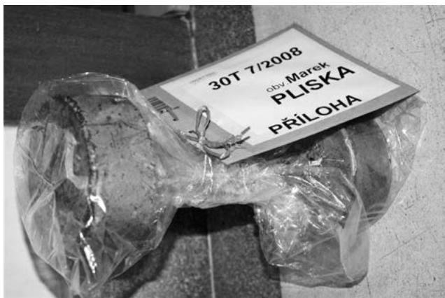
Vražedný nástroj – posilovací činka.

„Mám zbytek perníku,“ řekl Žanetě a šlehli si zbytek drogy společně. Otevřeli si k tomu šampaňské a přilepšili si další skleněnkou marihuany.