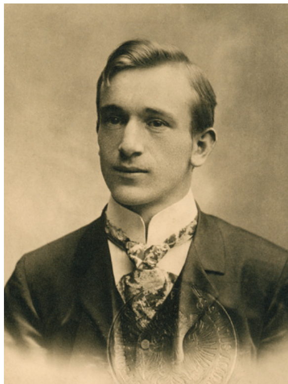
Ateliérová fotografie Edvarda Beneše jako maturanta, 1904.

vy, do muzeí a galerií i do divadel. Společně podnikali i výlety. Beneš byl v té době hodně radikální a rád své smělé názory dívkám