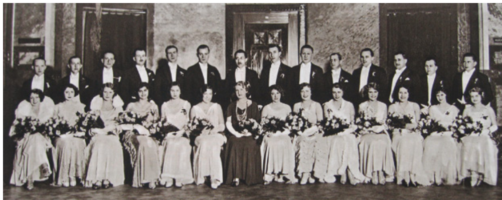
Hana Benešová jako čestný host XI. reprezentačního plesu spolku Komenský v Obecním domě. ( Pestrý týden , r. IV, 23. 1. 1932, č. 7)