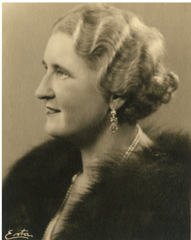
Ateliérová fotografie Hany Benešové z doby, kdy se stala první dámou, foto Esta, 1936. (ANM, H. Benešová, 4876)

Co je to tedy „elegance“ a proč ji tak intenzivně spojujeme s první republikou? Slovo „elegantní“ vychází z latinského „ elegantia “, což znamená uhlazenost, vkus a je odvozeno od „ elegere “, tj. slovesa „vybírat“. Schopnost výběru je s vkusem nerozlučně spojena. Netýká se však jen módy, ale i jazyka, chování nebo umění. 2 Je to vlastně abstraktní pojem, který může zachycovat značně subjektivní pohled na estetično. Krásný totiž ještě neznamená vkusný. Vkus je obecnější a trvalejší pojem než krása nebo móda. Vkus je spojen se schopností výběru. Vkus spojuje v charak-