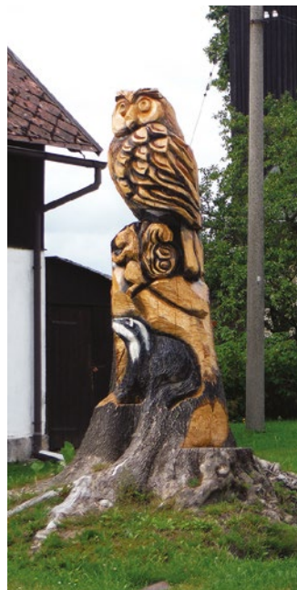
Ukázky řezbářských děl vytvořených z kmenů odumřelých stromů