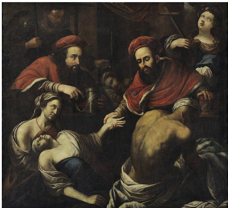
Český mistr: Svatí Kosmas a Damián v doktorských talárech vyšetřují měřením pulsu nemocné, 1698, Karolinum, Praha