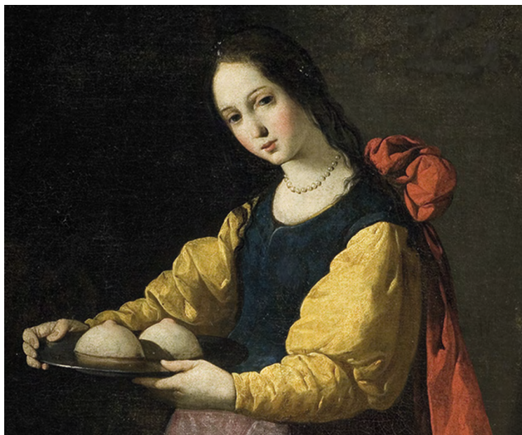
Francisco de Zurbarán: Sv. Agáta (detail), 1630–1633, Musée Fabre, Montpellier. Svěťice nese na tácu svá amputovaná prsa

v osmdesáti letech zemřel. Legenda hovoří o zázračném vyléčení jeho závažné choroby. Peregrin po zjevení Panny Marie vstoupil do řádu servitů. V posledním období svého života začal trpět rozsáhlým zapáchajícím zduřením bérce. Jeho lékař považoval onemocnění za nádor a navrhl amputaci končetiny. Večer před operací se nemocný usilovně modlil a ráno po probuzení již zduření nebylo patrné. Informace o zázračném uzdravení se rychle roznesla a Peregrin začal být uctíván, za svatého byl prohlášen až počátkem 18. století.