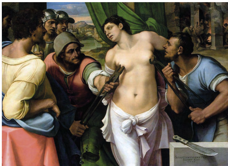
Sebastiano del Piombo: Martyrium Svaté Agáty, 1520, Galleria Palatina (Palazzo Pitti), Florencie. Mučící nástroje připomínají staré chirurgické nástroje pro amputaci prsu

prsu svatou Agátu vnímat jako svou patronku, protože její utrpení jim připomínalo utrpení vlastní. Agáta následkem mučení samozřejmě zemřela. Je zobrazována, jak nese svá uřezaná prsa na tácu (viz obr. na následující straně). Lidem výjev odebraných prsů umístěných na tácu připomínal tvarově zvony, takže byla vyhlášena i patronkou zvonů.