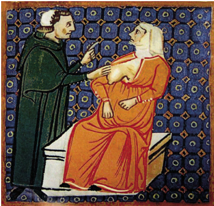
Vyšetřování či poučování ženy, která má bulku v prsu (Teodorico de' Borgognoni: Chirurgia , univerzitní knihovna v Lovani)

že operativní odstranění nádoru je v některých případech možné. Také tvrdil, že člověk k tomu, aby žil a nádor neměl, potřebuje absolutní rovnováhu čtyř tělesných šťáv – krve, hlenu a žluté a černé žluči.