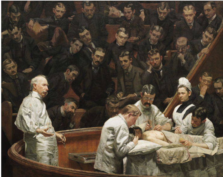
Thomas Eakins: Agnewova klinika, 1889, Pensylvánská univerzita, Filadelfie. Operace prsu prováděna v univerzitní posluchárně pro výuku mediků