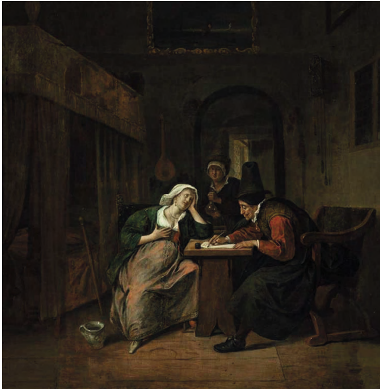
Jan Steen: Lékař a nemocná žena, kolem roku 1665, Národní galerie v Praze

Jaké další případy jste uváděla na přednáškách o historii zobrazování nádorů prsů, jež byla jedním z vašich oblíbených oborů?