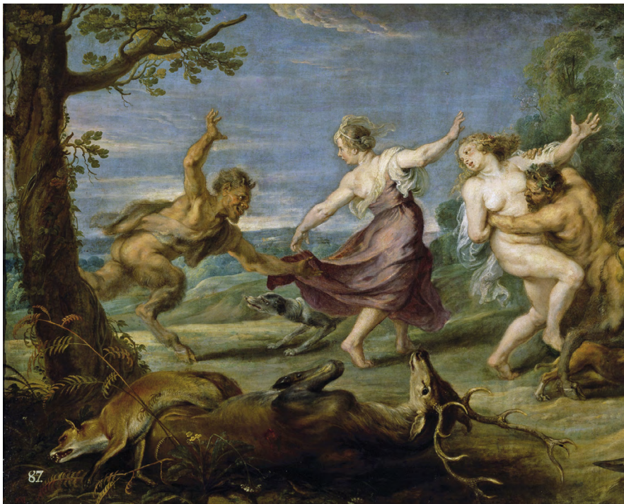
Peter Paul Rubens: Diana a nymfy překvapené satyry, 1638, Museo del Prado, Madrid