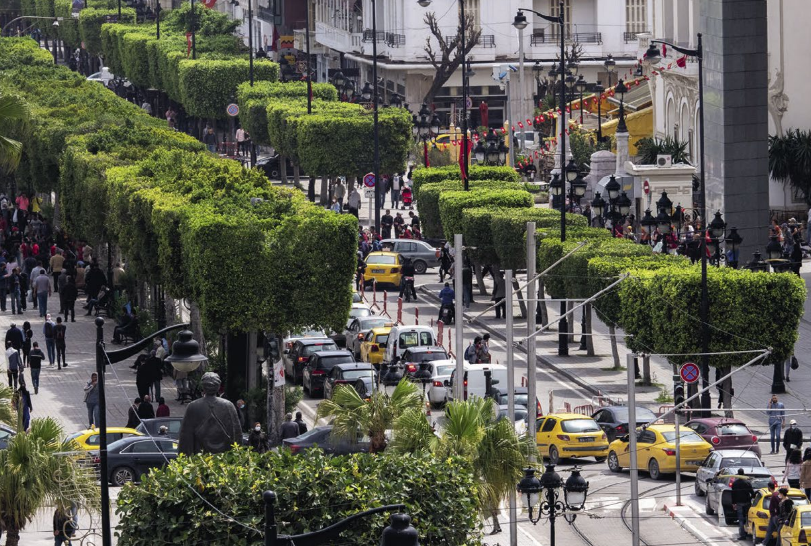
▲ Tunis, hlavní třída

opět ukazuje v celé své surovosti. Je 15:37 a dělníkům na nedaleké stavbě končí směna. Vbíhají do silnice, stopují auta, chytají taxíky, aby se co nejrychleji dostali pryč. S úsměvem procházíme davem a klestíme si cestu mezi skromně oblečenými lidmi, kteří netouží zjevně po ničem jiném, než vypadnout z prachu a horka ulice. Asi padesát metrů za křižovatkou nás ohlušuje rána a smýkání plechu po asfaltu. Otáčíme se a vidíme motorku položenou v křoví a sbíhající se dav Tunisánů. Po chvíli zpozorujeme, že na zemi nehybně leží člověk. Kolem něj už je asi padesát lidí, všichni lomí rukama a chytají se za hlavu, ale nikdo raněného neošetřuje. Chvilí nám trvalo, než jsme situaci odhadli, a asi po dvou minutách jsme vzali další vývoj do vlastních rukou. Prodral jsem se davem, Ivanovi vytrhl z ruky láhev vody a procpal se k raněnému, který už se probudil ze mdlob a zmateně cosi blekotal. Pomalu jsem si prohlédl asi šedesátiletého muže, který měl na obou stranách roztržené čelo, zlomený nos a nejspíše i čelní kost v oblasti pravého obočí. Místní mi záchrannou operaci příliš neusnadňovali,