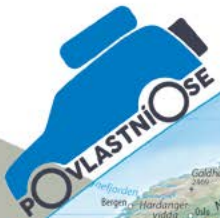
Trasa Velké cesty - 63423 km