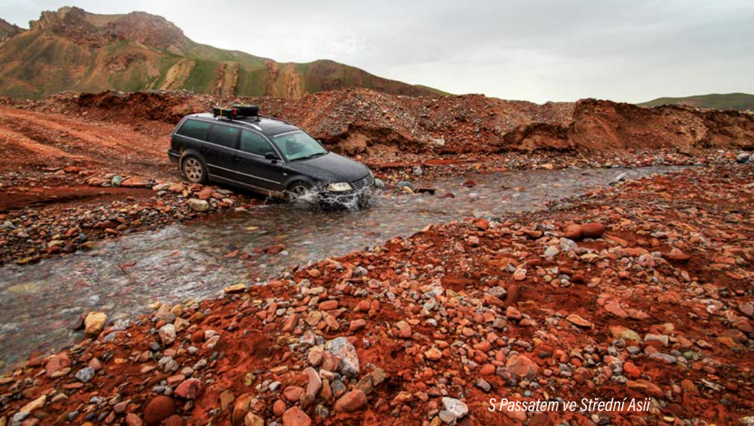
S Passatem ve Střední Asii

už musíme pokračovat dál. Za průsmykem Kyzyl-Art ve výšce 4280 metrů na nás čeká další středoasijská země – Kyrgyzstán. Kyrgyzstán důvěrně známe, nějaký čas jsme tady strávili během naší první cesty do Střední Asie v roce 2015. Už tehdy jsme si zamilovali zdejší přírodu a i odtud jsme si odnesli intenzivní zážitky, které nás zasáhly natolik, že jsme se sem rozhodli znovu vrátit a vidět z této nádherné země víc.