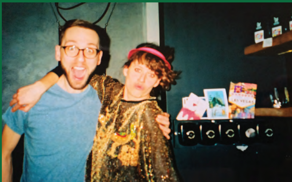
↑ Třetí narozeniny kavárny Industra Coffee, 2016

a naštvané recenze nás ale rychle naučili vycházet našim milým hostům vstříc. Nabídku jsme rychle rozšířili a cukr jsme měli taky (i když nebyl na každém stole, ale pouze na vyžádání na baru).