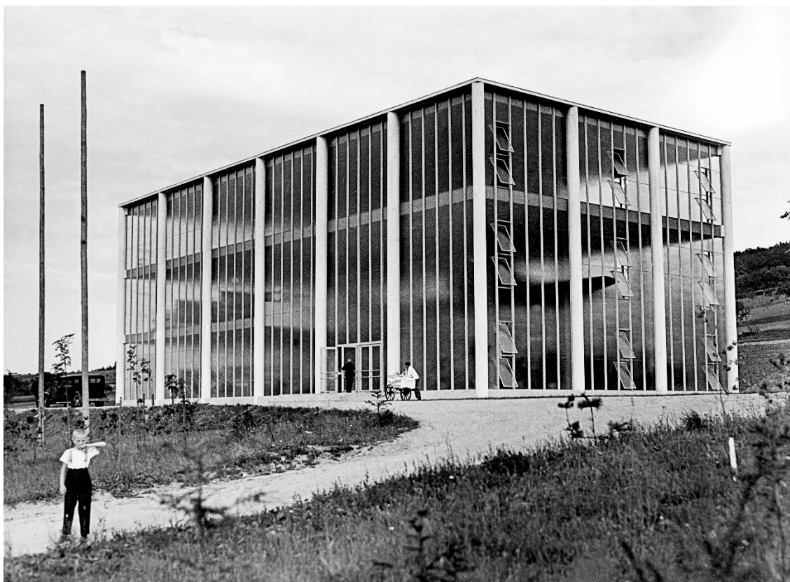
Památník Tomáše Bati ve Zlíně postavený r. 1933 podle návrhu Františka L. Gahury