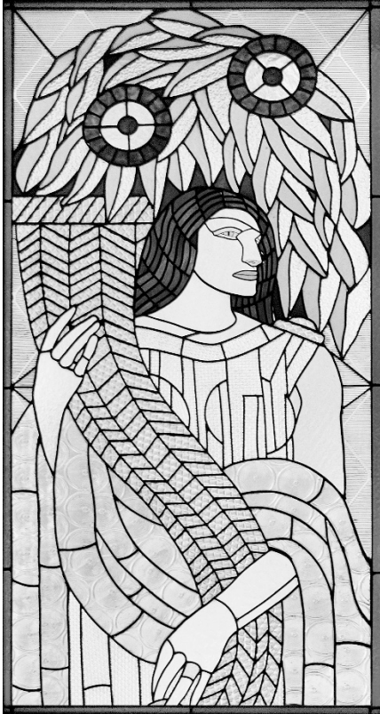
Vitráž podle návrhu Františka Kysely, Baťova vila ve Zlíně