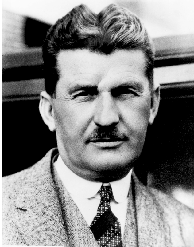
Tomáš Baťa, snímek z r. 1928-1929