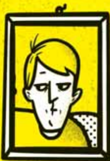
OTEC vie pochopiť klienta