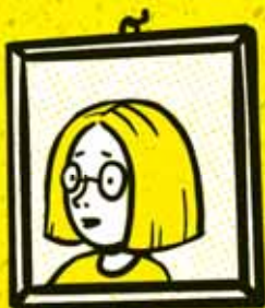
PETRUŠKA kamarátka najlepšia na svete