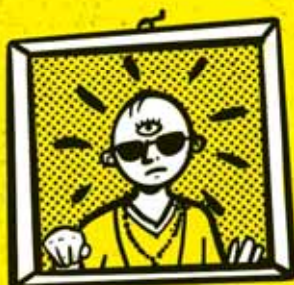
EXPERT NA DIVNÉ VECI