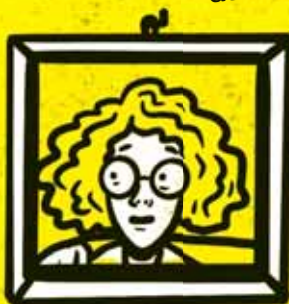
MAMA chce rozumieť deťom