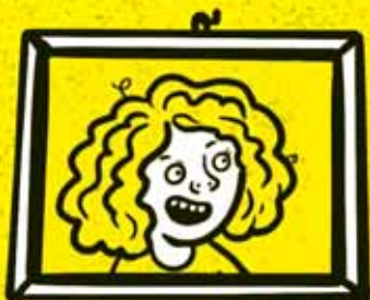
JA — DANKA viem pozorovať a raz budem rebelka