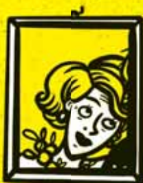
KRIŠTOFOVA MAMA docentka