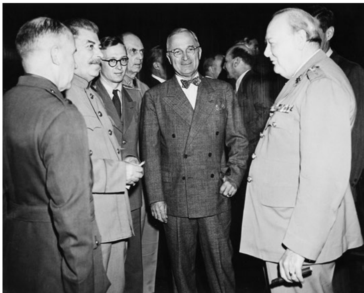
J. V. Stalin, americký prezident Harry Truman a Winston Churchill na Postupimské mírové konferenci v červenci 1945. „Kapitalismus a socialismus si nemohou porozumět, a proto je válka nevyhnutelná,“ prohlásil už 9. 2. 1946 v Moskvě Stalin.

Prezident Truman dal pokyn k vývoji ještě strašnější zbraně – vodíkové bomby. Národní bezpečnostní směrnice číslo 68, dokončená v dubnu 1950, však vykreslovala chmurný obraz. V roce 1954 by mohl mít SSSR asi 200 jaderných bomb. Proto musíme posílit naše pozemní, námořní a letecké síly tak, aby byly během dvou let zdvojnásobené! Rovněž Velká Británie a Francie zahájily zbrojení.