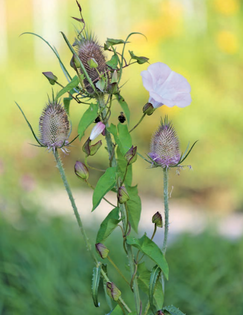
Opletník plotní se ovíví kolem štetky plané.