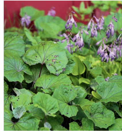
Podběl lékařský se vedle bohyšek na předzahrádce vydává za okrasnou trvalku.

Další, především jednoleté rostliny čekají pouze na to, až se při rytí dostanou na denní světlo. Jsou to oportunisté a osídlí každíčký kousek půdy. Nově založené květinové nebo zeleninové záhony – to je něco pro ně. Jejich semena bleskurychle vyklíčí a obsadí prostor dříve, než si jej stihne nárokovat vysévaná zelenina. Veškerou svou energii věnují rozmnožování, zatímco většina druhů zeleniny je dvouletá nebo víceletá a potřebuje nejprve dobrý kořenový systém – stačí si vzpomenout na mrkev, mangold, topinambur nebo cibuli. Merlík bílý je úplně stejný dobyvatel.