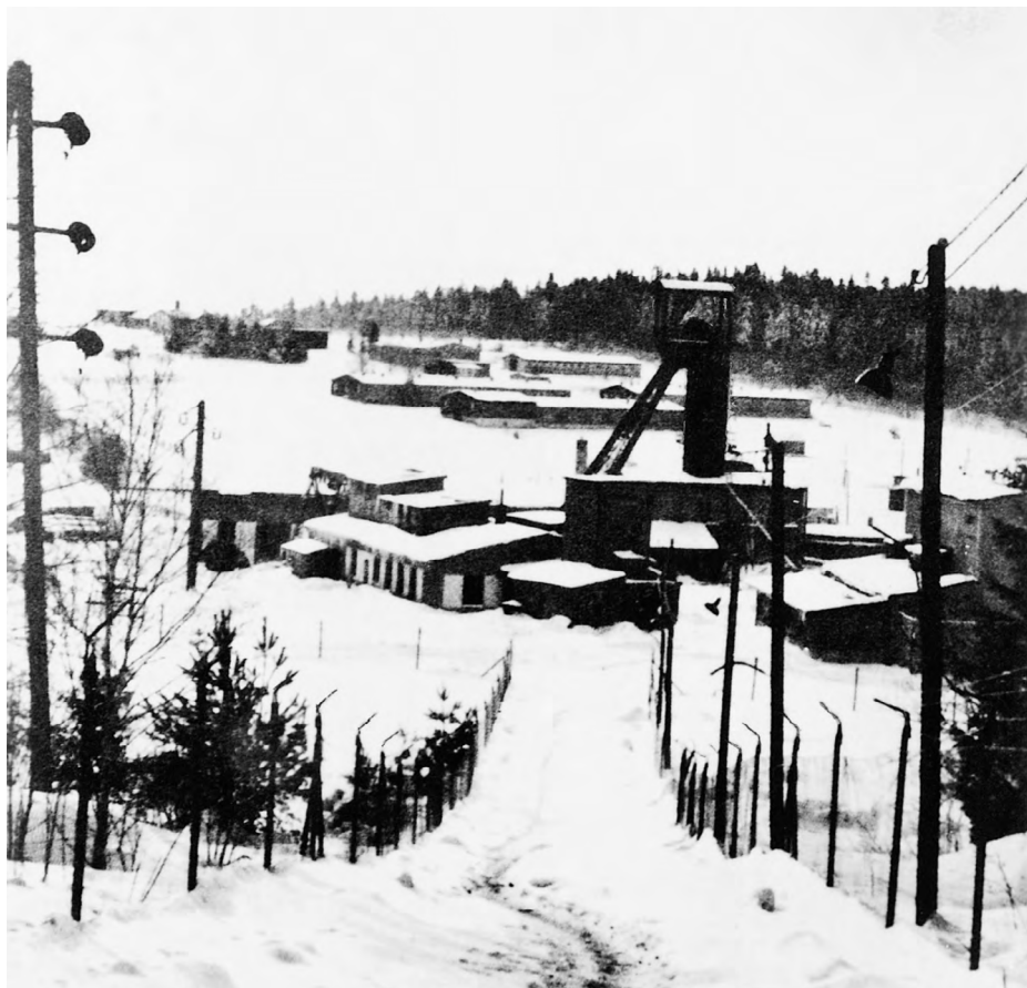
Obr. č. 1: Trestanecký pracovní tábor Vojna v padesátých letech

nomiky. Práce však i nadále představovala výchovný prostředek sloužící k nápravě vězně, především odsouzeného pro kriminální zločiny. Ve vězeňských zařízeních byly uplatňovány militaristické a agenturně-operativní prvky k zajišťování kázně vězňů a zároveň využívány výchovně vzdělávací prostředky k politické indoktrinaci vězňů. Toto lze považovat za základní prvky sovětizace československého vězeňského systému, které byly implementovány a realizovány v různém měřítku.