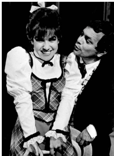
Hello, Dolly (Hudební divadlo Karlín, 1982) v roli Minnie.