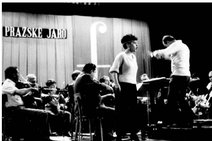
Vítězka pěvecké soutěže Pražského jara 1986.