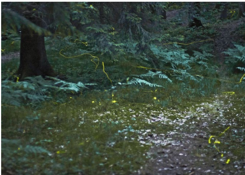
Kouzlo: světlušky zanechaly světelnou stopu

Převedeno na společného jmenovatele, hmyz toho skutečně nepotřebuje k životu mnoho: potravu pro své larvy i pro dospělé, vodu a především nerušená místa k nakladení vajíček, ke hnízdění, k přezimování a k vývoji larev a kukel. Hmyz se v průběhu miliony let trvajících vývoje přizpůsobil ročnímu cyklu rostlin. Rostliny kvetou na jaře a v létě, poté odkvetou a tvoří semena a plody. Nakonec uschnou nebo zatahnou listy a zůstanou přes zimu stát. Právě to je důležité, neboť mezi těmito rostlinami odpočívá hmyz, ať už ve formě vajíčka, larvy, kukly nebo dospělé. A přesně to už hmyz v mnoha zahradách nenachází, a na zemědělsky obhospodařovaných plochách už vůbec ne. Seče se častěji než dříve, takže u nás místo pestrých barev (nebo hnědi zvadlých rostlin) stále převažuje zelená. Mnohem častěji se rostliny zastřihují nebo jsou z nich odstraňovány uvadlé kusy – ale tím i hmyz, který se do nich stáh! To, co potřebujeme, je návrat k přirozenosti! Proto musíme také změnit svůj náhled, neboť odkvetlé a zvadlé neznamená nepořádné, ale přirozené a plné života. Pohlédněte na zahradu, městskou zeleň okolo vás,