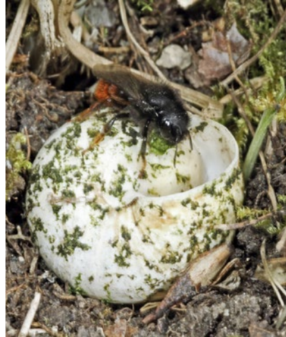
Zednice dvoubarevná staví svá hnízda v prázdných ulitách hlemýžďů (viz strana 90)