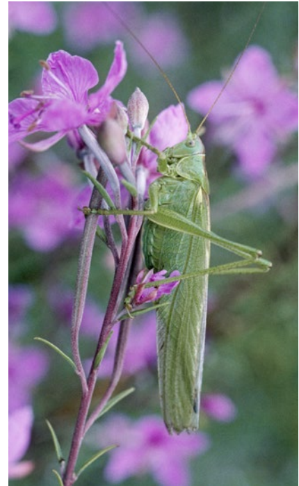
Kobylka zelená je největším druhem u nás žijících kobylek

vají vnitřní orgány. Tvrdá vnější kostra poskytuje hmyzímu tělu oporu a slouží jako úchyt pro svalstvo. Chceme-li odlišit hmyz od pavouků, stonožek a stejno- nožců, stačí pouze spočítat nohy: hmyz má VŽDY šest nohou!