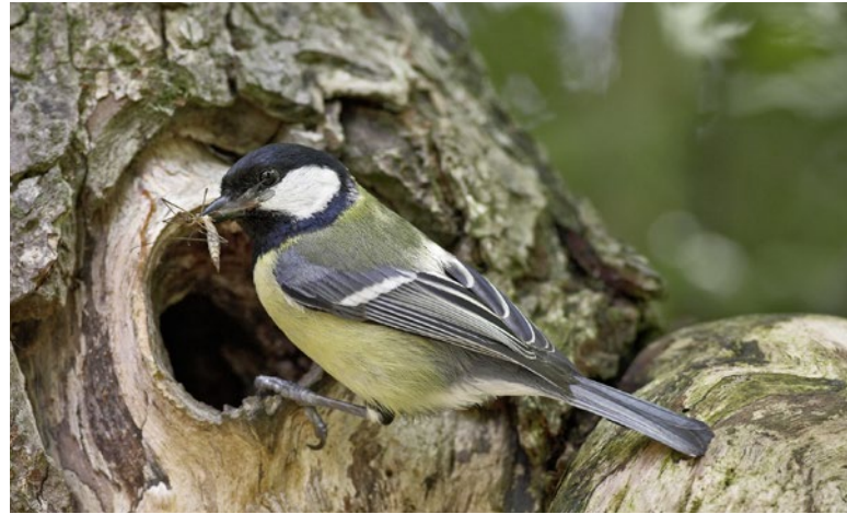
Sýkora koňadra ulovila tiplici. Hmyz a jeho larvy jsou nesmírně důležitou potravou pro většinu ptačích mláďat!

— Hmyz jako potrava Mnoho druhů hmyzu, jako jsou mšice, jepice, kobylky a brouci či motýli a jejich housenky, je důležitou potravou pro ptáky, žáby, ježky, ještěrky a množství dalších zvířat.