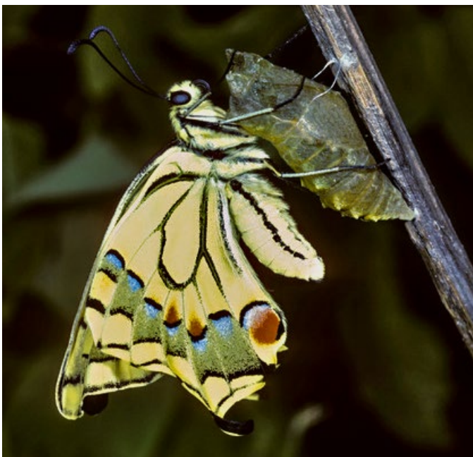
Otakárek fenýklový se právě vylíhl z kukly

a dvoukřídlého hmyzu, vypadají larvy zcela odlišně než dospělý hmyz. Často také žijí na jiném místě a přijímají rozdílnou potravu. Jakmile larva dosáhne konečné velikosti, vloží do své cesty k dospělému hmyzu stadium kukly. Larva se změní na kuklu, její tělo se zcela rozloží a přestaví na tělo dospělého hmyzu. Ten již více neroste: brouci, včely, vážky a všechna ostatní imaga už nemohou vyrůst. To ani není jejich úlohou. Musejí si najít partnera k rozmnožení a naklást vajíčka. To jde často mnohem rychleji než samotný růst. Proto má život dospělého hmyzu často mnohem kratší trvání než život larvy.