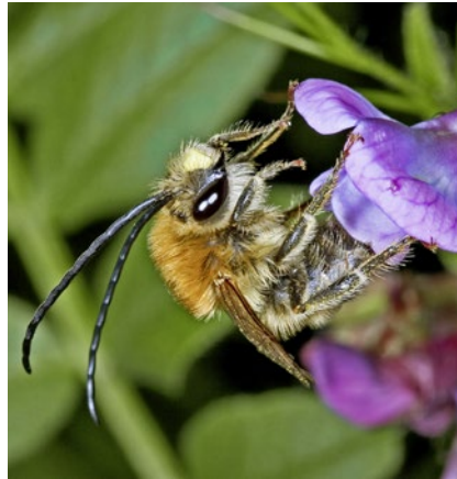
V květnu vylétá stepnice načernalá s nápadně dlouhými tykadly

Mezi drobnými živočichy dokážeme hmyz rozeznat opravdu jednoduše. Tělo všech druhů hmyzu se skládá ze tří částí: hlava obsahující složené (fasetové) oči, ústní ústrojí a tykadla (antény), hrud' se třemi páry nohou a většinou dvěma páry křídel, a také zadeček, ve kterém se skrý-