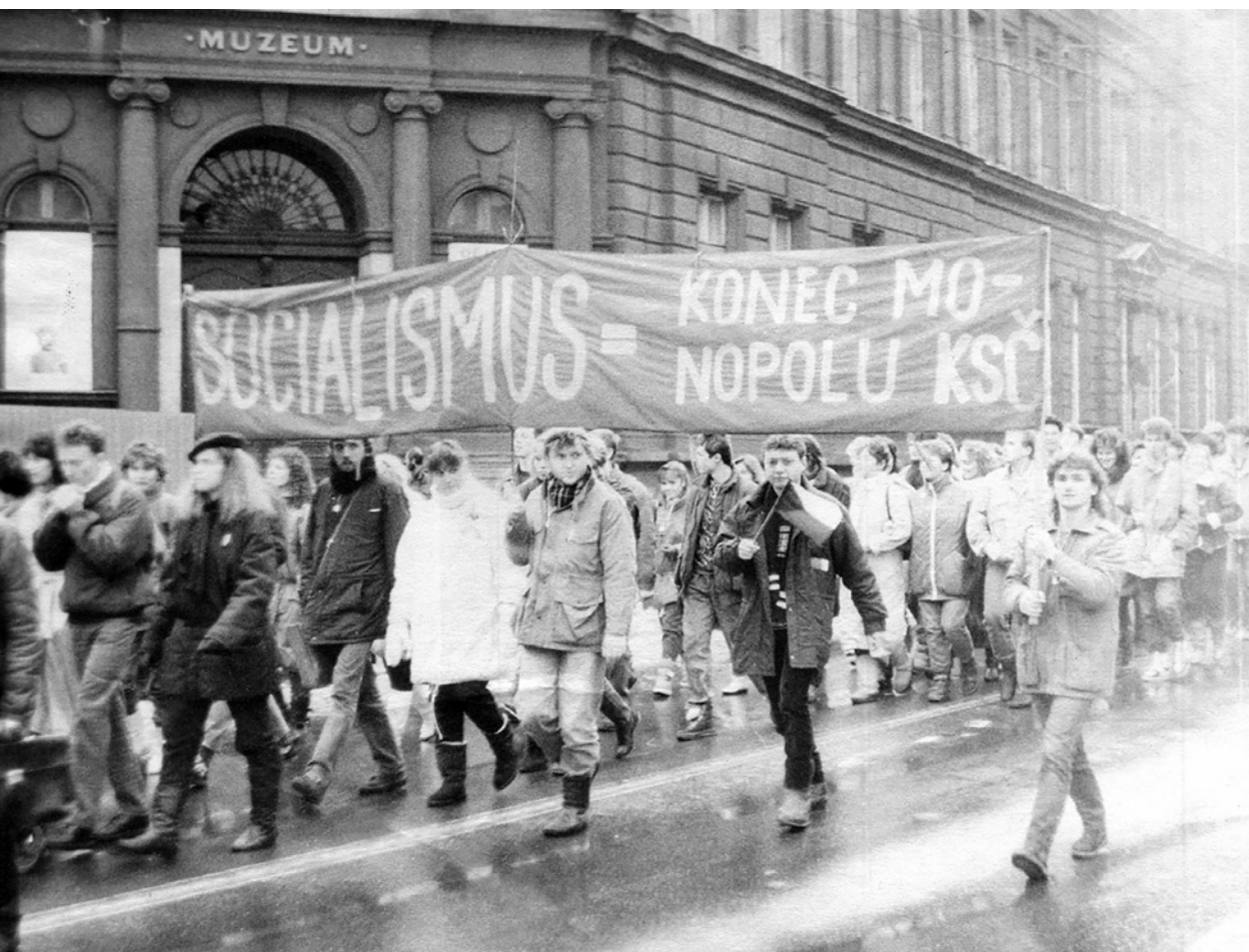
Průvod studentů prochází centrem města Ústí nad Labem (1989).