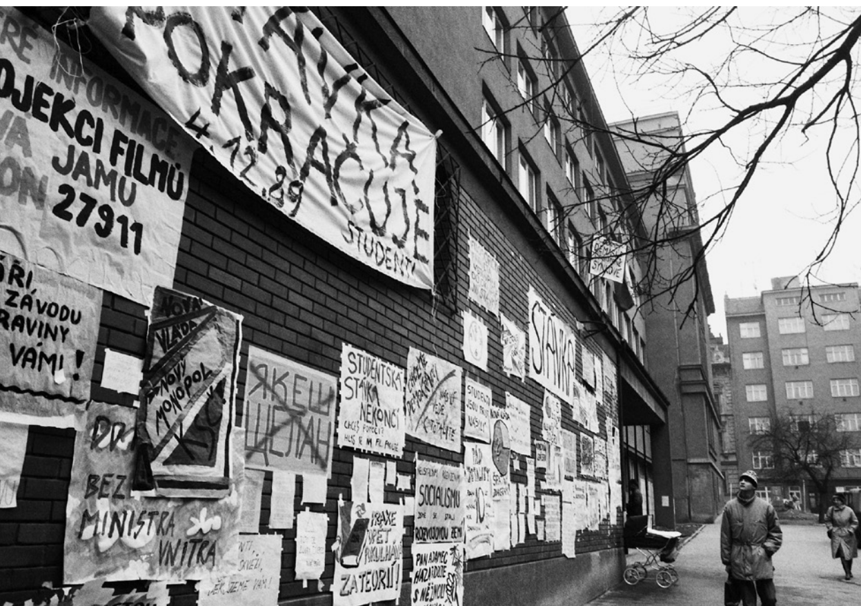
Budova filozofické fakulty Univerzity Jana Evangelisty Purkyně v Brně polepená plakáty (listopad 1989).

osobních deníků a na jejich základě začíná psát své komponované deníkové dílo, doplněné o retrospektivní a vzpomínkově laděné glosy a poznámky. 85