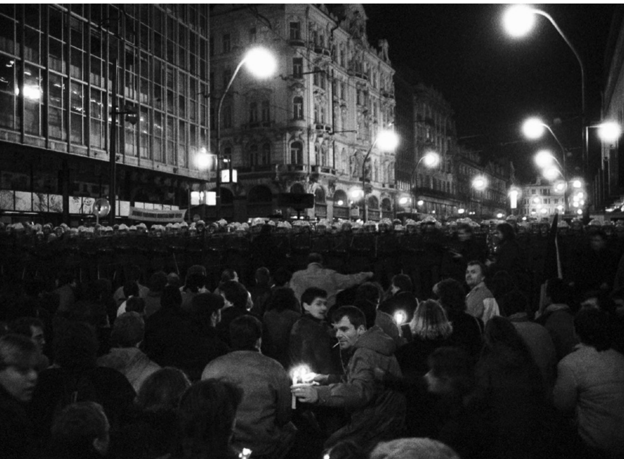
Policejní kordon proti demonstrantům na Národní třídě v Praze – ochranné štíty (17. 11. 1989).