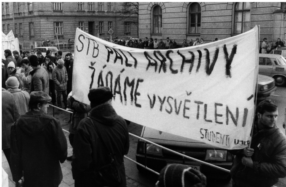
Listopad 1989 v Brně. Demonstrace před Krajskou správou SNB na Leninově ulici.

působení – do značné míry totožná s pamětí „společenské většiny“. 116 S časovým posunem, odchodem těchto aktérů z aktivního profesního života a hlavně s proměnou tuzemského i globálního společenského klimatu se však zdá, že tento „status quo“ nebude mít již dlouhého trvání a na základě reinterpretace pamětního dědictví „zlatých šedesátých“ let dojde ke katarzi a k novému kolu „souboje“ i o „pamětní odkaz“ této skupiny.