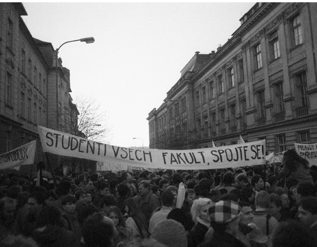
Účastníci studentského shromáždění v den 50. výročí 17. listopadu 1939 na Albertově. Transparent, nápis „Studenti všech fakult, spojte se“.