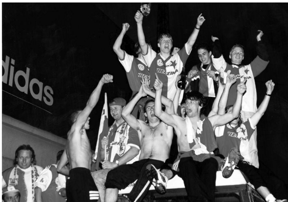
Mistři na traktoru.

Dřív, než se v Edenu zrušila atletická dráha, drtil škváru. Zapřáhl se za něj válec, který utemoval trávu nebo ji bodáky provzdušnil. Byl to inventář Slavie. Jako si milenci dávají rande pod koněm u sochy svatého Václava, my jezdili oslavovat k traktoru, který většinou stával zaparkovaný u vestibulu.