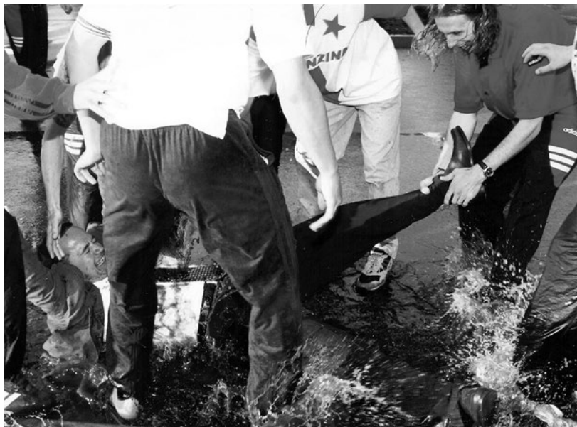
Velký šéf a největší louže.

Náhoda je blbec. Zastavili jsme, abychom protáhli záda, koupili si horalky nebo žvýkačky proti nudě, a za pár minut jsme zažili něco, o čem se vám ani nesní. První titul nic nepřebije. Ani jsem si nestačil uvědomit, co se stalo, a všude kolem už se lepilo rozstříkané šampaňské. Kluci vyskákali z autobusu, div si nezpřelámali nohy. Křičeli,