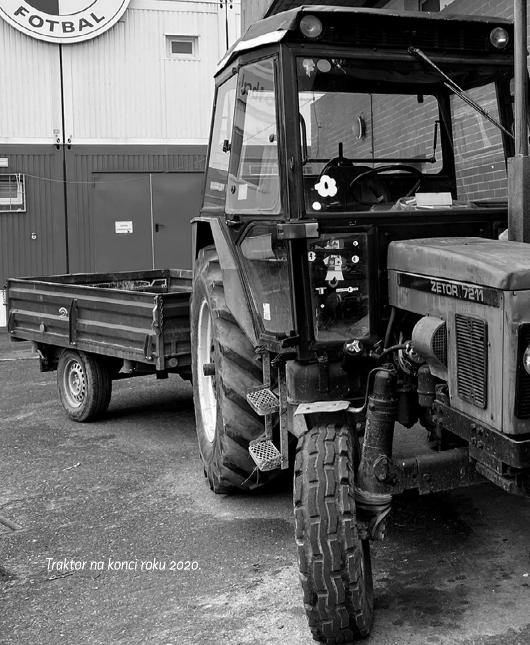
Traktor na konci roku 2020.