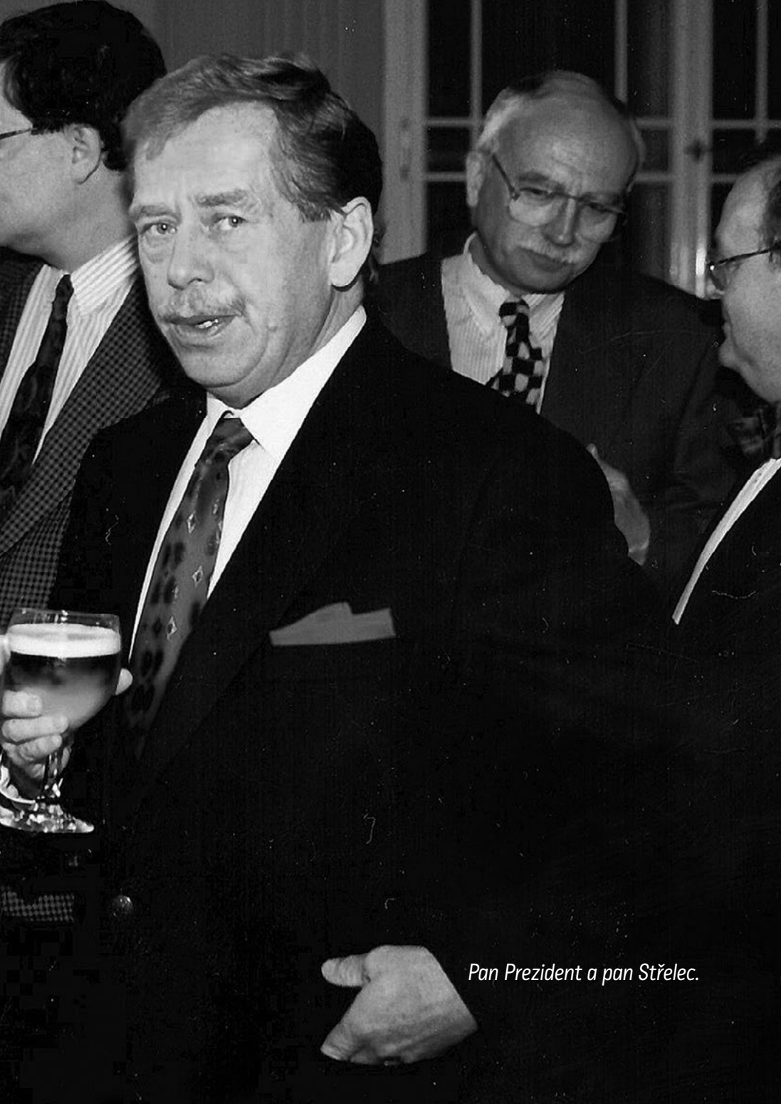
Pan Prezident a pan Střelec.