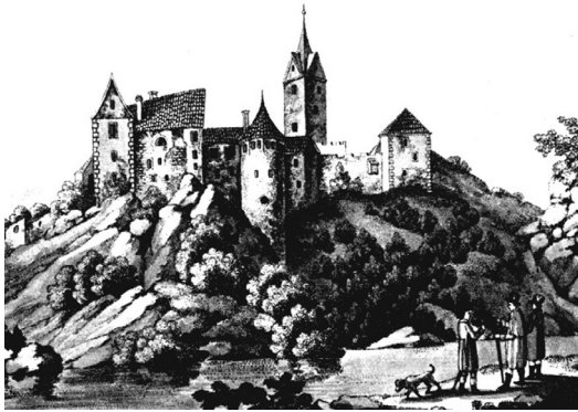
Loket na počátku 19. století

Půvabnou, byť trochu omšelou – a nespojitou – Zámeckou ulicí sejdem na hlavní náměstí T. G. Masaryka (za náměstí je považuji já, oficiálně jde překvapivě o ulici). Má zajímavý zakulacený tvar, volně kopírující jižní oblouk hradu, a opět jako by tonulo v jeho stínu. Přitom jsou tu zajímavé památky: pěkný trojiční sloup, dvě kašny a barokní radnice (v jejím areálu najdeme i městskou knihovnu a Muzeum knižní vazby); a celá řada hodnotných domů, původně gotických či barokních. Většinou prošly pozdějšími úpravami a dnes nastavují náměstí svá klasicistní, empírová či novorenesanční průčelí, takže si každý přijde na své. V mých očích jsou nejkrásnější sousední domy T. G. Masaryka 4/75 a Sobotova 10/2 (druhý jmenovaný skrývá Muzeum lázeňských pohárků).