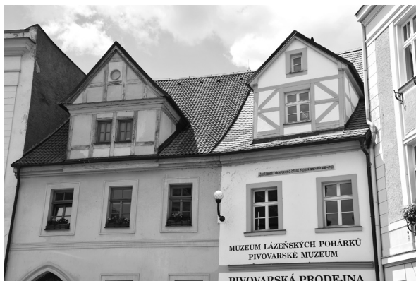
Pohlední sousedé: T. G. Masaryka 4/75 a Sobotova 10/2

Kostelní 81/25. Zato budova Základní školy Loket na opačné straně příliš půvabu nepobrala a její kostka městský oblouk spíše kazí.