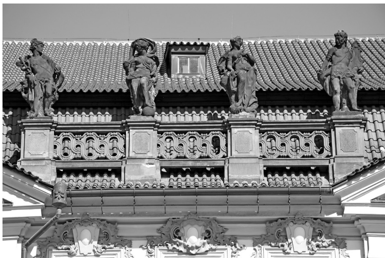
Sochy Ignáce Františka Platzera na atice paláce Golz-Kinských