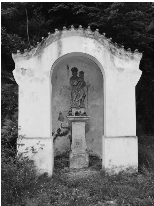
Výklenková kaplička u Rakovnického potoka

od matky, opuštěn otcem, bez možnosti dětských her s vrstevníky, vyjížděk do přírody a dalších zábav šlechtických dětí. Sice už tady nebyl držen v nějakém sklepení jako na Lokti, měl k dispozici několik pohodlných komnat, ale co to bylo platné, když je nasměl opustit? Maximálně se mohl procházet po hradním nádvoří a hradbách s doprovodem stráží. Odpovědnost za jeho bezpečnost nesl křivoklátský purkrabí Oldřich řečený Pluh.