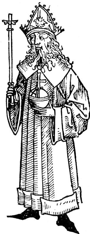
Karel IV. v Schedelově (Norimberské) kronice

Využit strategické polohy pravěkého hradiště k obranným účelům se rozhodl až roku 1110 kníže Vladislav I. Archeologové zjistili, že úzká šíje byla tehdy prokopána příkopem (nebo byl prohlouben ten dosavadní) a nad ním, na vystupující skále, teprve v pozdějších etapách obestavěné a srovnané v terasu, byla vztyčena mohutná válcová kamenná věž o průměru 12 metrů. Byla zřejmě stavbou současně obrannou i obytnou. K ní patřila už jen zděná obdélníková budova s rovnými trámovými stropy, uzavírající napříč prostor za věží a oddělená od zbytku zaniklého hradi-