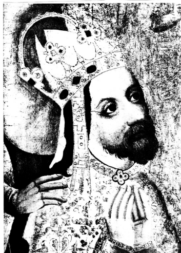
Karel IV. na votivním obrazu Jana Očka z Vlašimi

Málokde na člověka tak dolehne povznášející (a současně trochu mrazivý) pocit moci a síly, jako když poprvé spatří z mostu přes Ohři hrad Loket, to drsné nakupení strohých kamenných zdí a věží, do jejichž stěn jako by prorůstaly hroty žulových skal. Tohle mimořádné sídlo si troufám srovnávat s proslulou Mont-Saint-Michel na normanském pobřeží. Naši horu s hradem a opevněným městem však neobklopuje mořský záliv, ale něco neméně pozoruhodného: unikátní meandr řeky Ohře. Stojím na úzké, jen několik metrů široké šíji, oddělující dvě údolí téže řeky. Nemohu odtrhnout pohled od místa, kde Ohře náhle odbočí v nečekaně ostrém úhlu, skuteč-