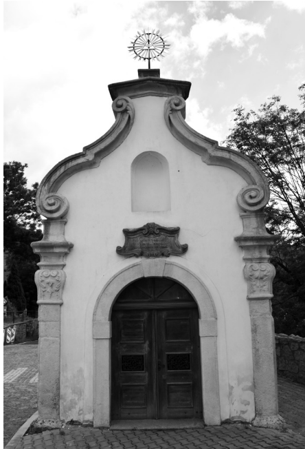
Kaple sv. Anny na terase nad Zahradní ulicí

pitulaci a vydání hradu. Došlo k dosud neslýchanému boji mezi manželi. Bitka se protáhla dlouho do noci, aniž se obléhatelům podařilo dosáhnout úspěchu. Na obou stranách už bylo několik raněných i padlých.