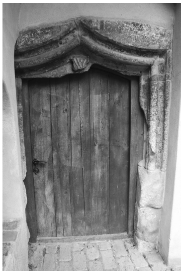
Jagellonskou etapu prozrazuje na hradě také iniciála W, patřící Vladislavu Jagellonskému

se snažili pozvednout celou křivoklátskou oblast k hospodářskému rozkvětu, ale přitom udržet její lesní svéráz a obohatit ji o další zajímavé stavby, s nimiž se ve zdejších lesích setkáváme takřka na každém kroku. Bohužel roku 1826 zachvátil hrad další obrovský požár, který ho téměř zničil. Zůstaly jen očázené zdi. Veškeré vnitřní vybavení vzalo zasně, shořely i cenné archivní materiály, někde se propadly stropy... Ačkoliv Fürstenberkové na Křivoklátě nesídlili (pro osobní potřebu využívali zámek v Nižboru), uvědomovali si jeho hodnotu jako jedinečné památky a snažili se ho zachránit. Do rekonstrukčních prací vložili nemalé prostředky. Zpočátku však docházelo ke zcela necitlivým zásahům, neboť hrad byl přestavován podle momentálních potřeb hospodářského provozu. Teprve Mockerova akce (která přišla doslova „v hodině dvanácté“!) zachránila jeho původní historickou hodnotu. Roku 1929 byl Křivoklát od Fürstenberků vykoupěn československým státem a od té doby prošel několika dalšími rekonstrukcemi.