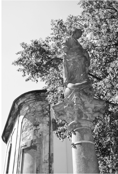
Madona na Mariánském sloupu u kostela sv. Anny v Sedlci