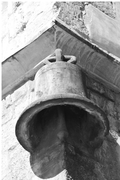
Kamenný zvon dal jméno výjimečnému domu

Důkladná regotizace vrátila domu téměř původní podobu, včetně tvaru střechy a oken, jejichž kružby se podařilo sestavit z kousíčků nalezených ve výplních zazděných oken a výklenků. Ve vnitřních prostorách byly odkryty dřevěné stropy a zpod omítek se vyloupily středověké nástěnné malby obou kaplí a audienční síně. V úplnosti byla odkryta také zdobná gotická fasáda. Ukázalo se, že výklenky mezi okny původně vyplňovaly kamenné sochy, posazené na konzolách a shora chráněné kamennými baldachýny. V nikách mezi okny prvního patra bychom kdysi viděli sochy krále a královny (Jana Lucemburského a Elišky Přemyslovny), sedící na trůně a po stranách doprovázené pěšími rytíři v plné zbroji. Snad to byli takzvaní štítonoši, ale také se usuzuje, že mohlo jít o podobizny jejich synů, princů Václava (Karla) a Jana Jindřicha. Torza těchto soch při rekonstrukci sestavil z úlomků restaurátor Jiří Blažej a dnes je můžeme vidět v kapli v přízemí. Sochy z výklenků dru-