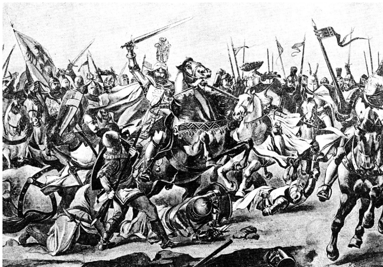
Smrt Jana Lucemburského v bitvě u Kresčaku

o svobodném odchodu ze země. Jan Lucemburský se tak díky své manželce Elišce téměř nenásilně a bez krveprolití zmocnil Prahy. A ubytoval se v jejím paláci U Kamenného zvonu.