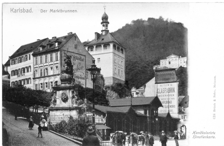
Morový sloup, Tržní kolonáda a Zámecká věž v roce 1898

historie zdejších lázní velmi hluboko do minulosti. V dobách, kdy v Loketské oboře lovil císař Karel, byly Vary už známým a proslulým místem. Císař zřejmě hledal úlevu v blahodárné minerální vodě, horké koupele zmírňovaly úporné bolesti jeho páteře, jimiž trpěl po záhadném úrazu; údajně se inkognito zúčastnil rytířského turnaje a úder dřevcem do brady mu zlomil čelist a poškodil krční páteř. Je skoro zázrak, že toto zranění přežil! Proto panovník během pobytu na Lokti pravidelně zajížděl do Varů.