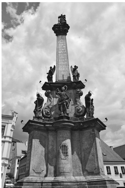
Sloup Nejsvětější Trojice v ulici T. G. Masaryka

byli brzy královským vojskem přemoženi – a trestu neušli. Vilém Zajíc z Valdeka byl zbaven úřadu nejvyššího maršálka a uchýlil se na své podbrdské panství; jeho místo zaujal jeho sok Jindřich z Lipé. Také bývalý opat zbraslavského kláštera Konrád, který se kdysi nejvíc zasloužil o příchod Jana Lucemburského na český královský trůn, se uchýlil do ústraní svého kláštera a vzdal se jakékoliv další politické a veřejné činnosti. Jen tím unikl pomstě zuřícího panovníka.