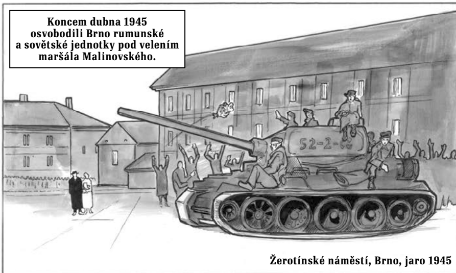
Žerotínské náměstí, Brno, jaro 1945

Koncem dubna 1945 osvobodili Brno rumunské a sovětské jednotky pod velením maršála Malinovského.