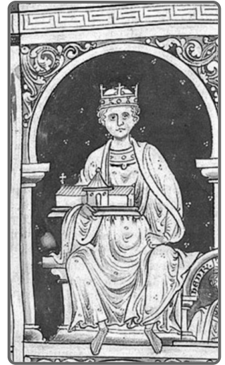
Anglický král Jindřich II., jemuž Tomáš Becket věrně sloužil jako kancléř.

V těch časech však byli ještě přáteli a král se na svého kancléře mohl ve všem spolehnout. Jindřich II. k němu pociťoval důvěru, vždyť Becket mu byl za své povýšení zavázán a vysoký úřad, který zastával, plnil k jeho naprosté spokojenosti. Navíc byl nejbližším královým rádcem i oddaným spolubojovníkem v bitvách, které musel v Anglii Jindřich II. se svými odpůrci svádět. Jak mohl tenkrát anglický král tušit, že si v tomto vychytralém klerikovi, kterého mu doporučil tehdejší canterburský arcibiskup Theobald, hřeje na prsou hada?