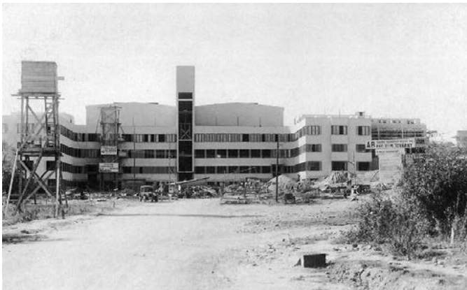
Stavba filmových ateliérů byla zahájena po Vánocích 1931 a natáčet se začalo v lednu 1933.

zájem, byla správní radou společnosti A-B jmenována zvláštní komise a té bylo nařízeno hledat a zkoumat vhodná místa pro ateliéry. Kandidátských míst bylo víc, kupříkladu i Kavčí hory, kde později vyrostl televizní areál. Barrandovská pláň však výběrovou komisi nakonec nadchla nejvíc. Skýtala ideální podmínky: čisté ovzduší, bezhlučné prostředí včetně vzdálenosti od hlavních leteckých linek (to už neplatí), volný obzor.