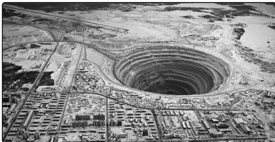
Celkový pohled na sibiřský kolský vrt jasně odhaluje, o jak monumentální akci se jednalo a na jak vysoké úrovni musela být zajištěna infrastruktura.

Jenomže co je nevysvětlitelné či záhadné? Existuje vůbec něco, co můžeme tímto slovem označit? Nebo je nevysvětlitelné