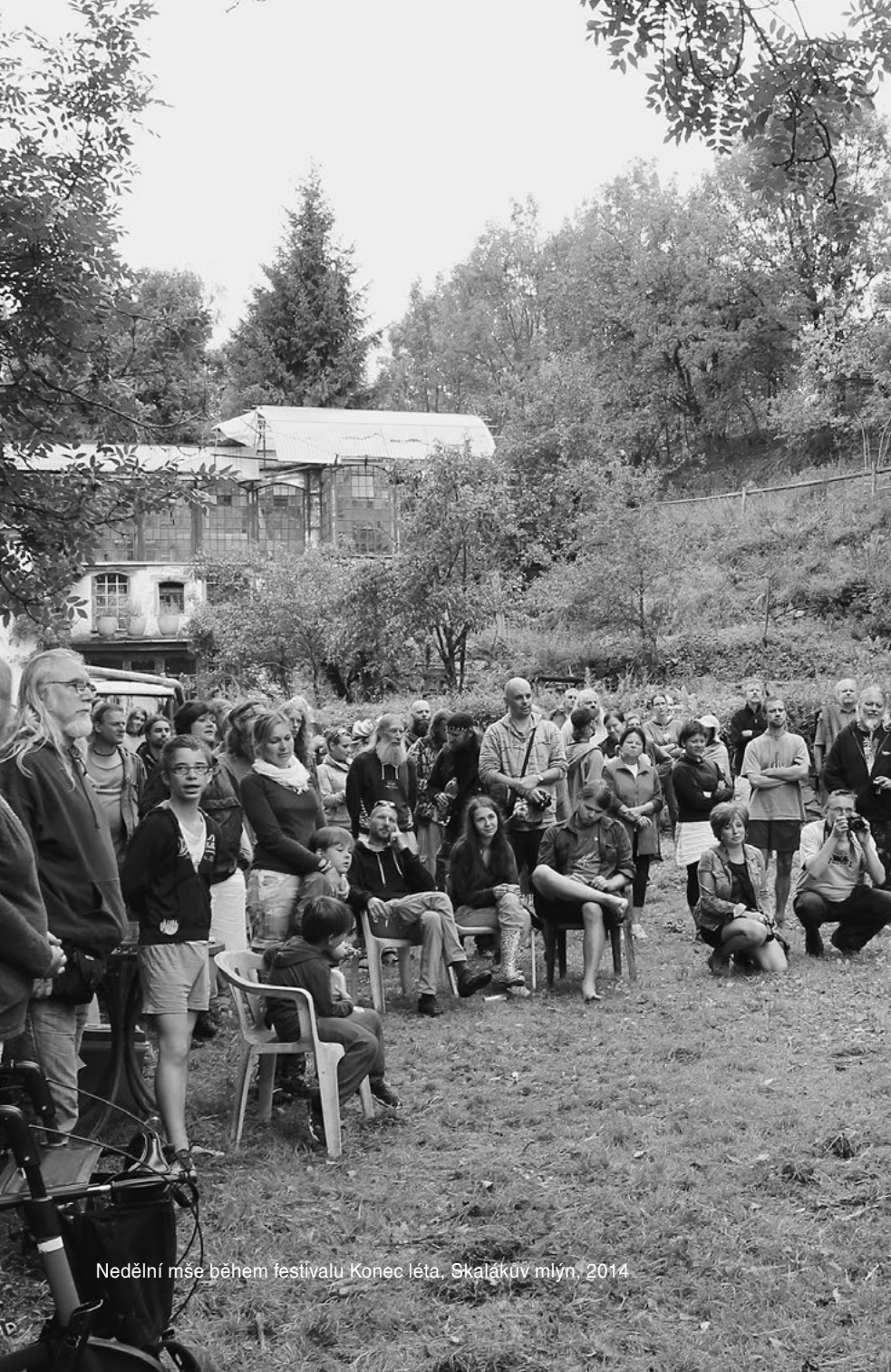
Nedělní mše během festivalu Konec léta, Skalákův mlýn, 2014