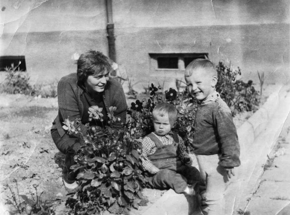
S maminkou a bratrem na zahrádce v Petřvaldě, 1962