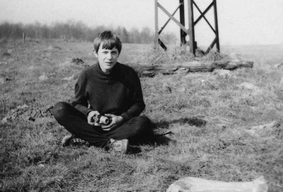
Lovy beze zbraní, 1973