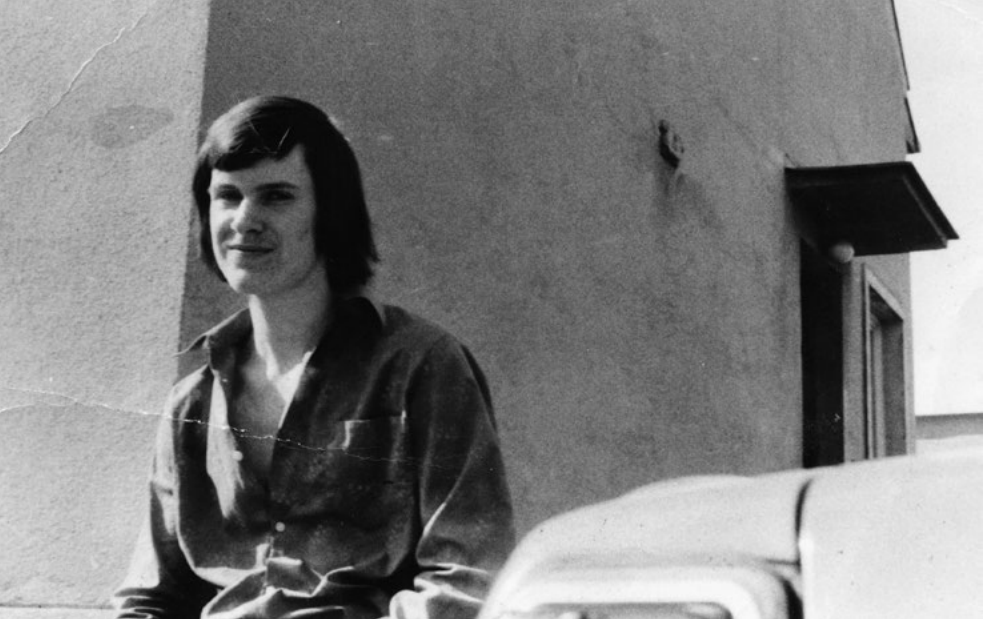
Doma na dvoře, asi tak sedmnáctiletý, 1977

v místní drogerii a také velký fotbalový činovník a organizátor farních poutí. Chodil jsem si k němu každé pondělí do drogerie „pro noviny“, tedy Katolické noviny, které mi koupil v neděli v kostele.